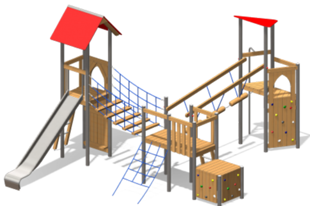
Kletterkombination mit Rutsche

Vorläufige Auswahl der Spielgeräte (oder ähnlich von anderen Herstellern):