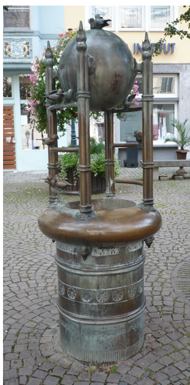
Spatzenbrunnen am kleinen Münsterplatz