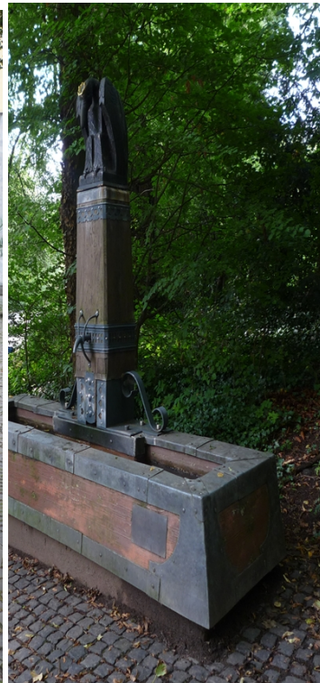
Eupener Straße am Alt-Linzenhäuschen