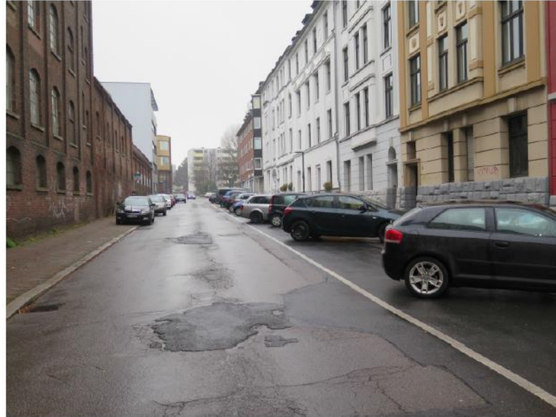
Denwartstraße in Richtung Jülicher Straße