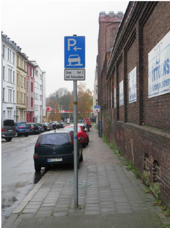
Nebenanlagen, aufgeschultertes Parken