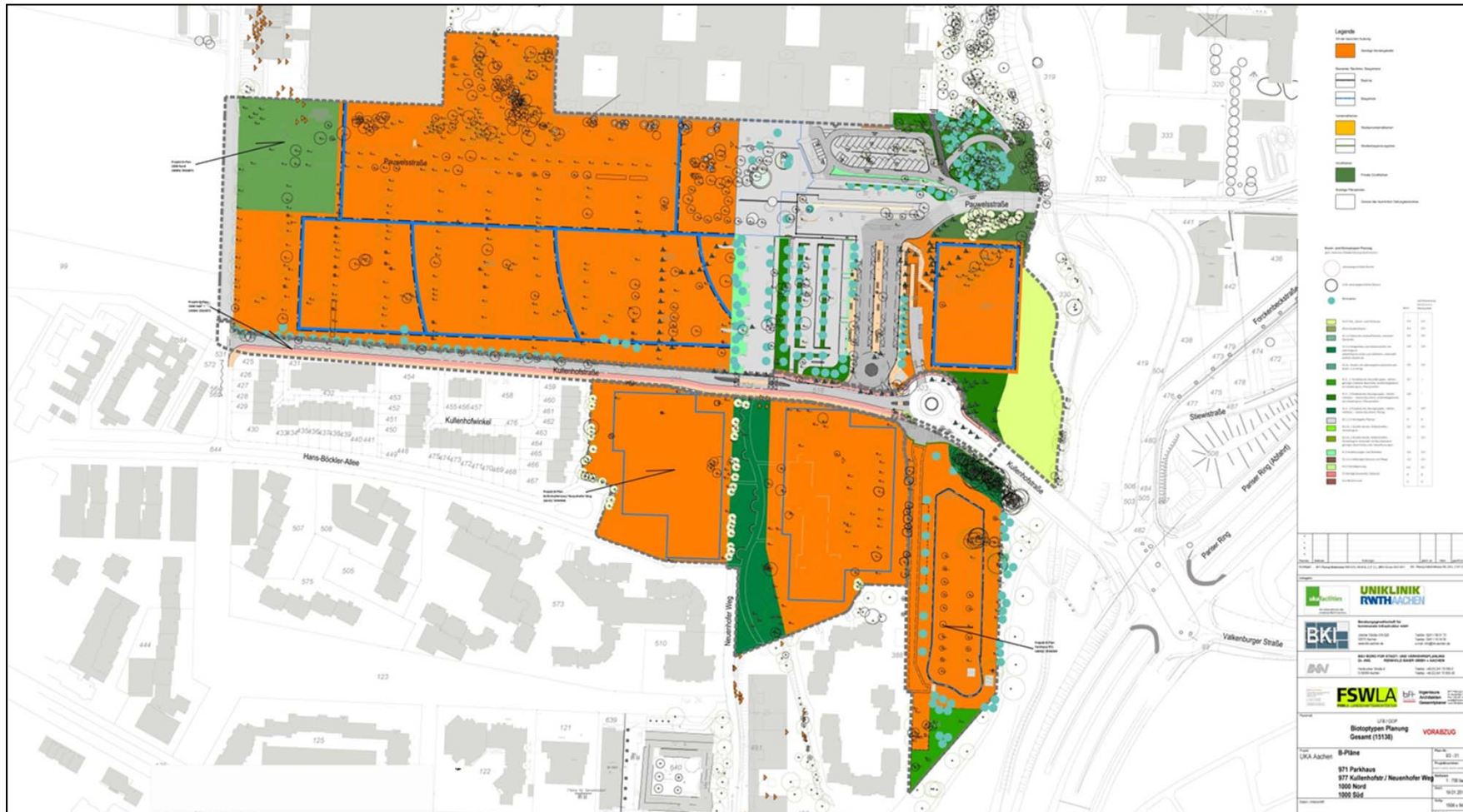
UKA 1.BA MedMoP – B-Plan-Verfahren