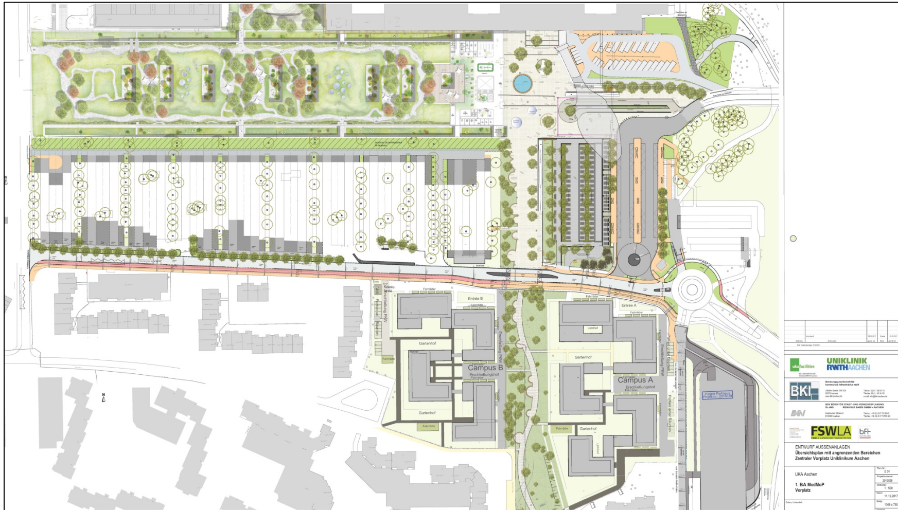
UKA 1.BA MedMoP – B-Plan-Verfahren - © ukafacilities GmbH