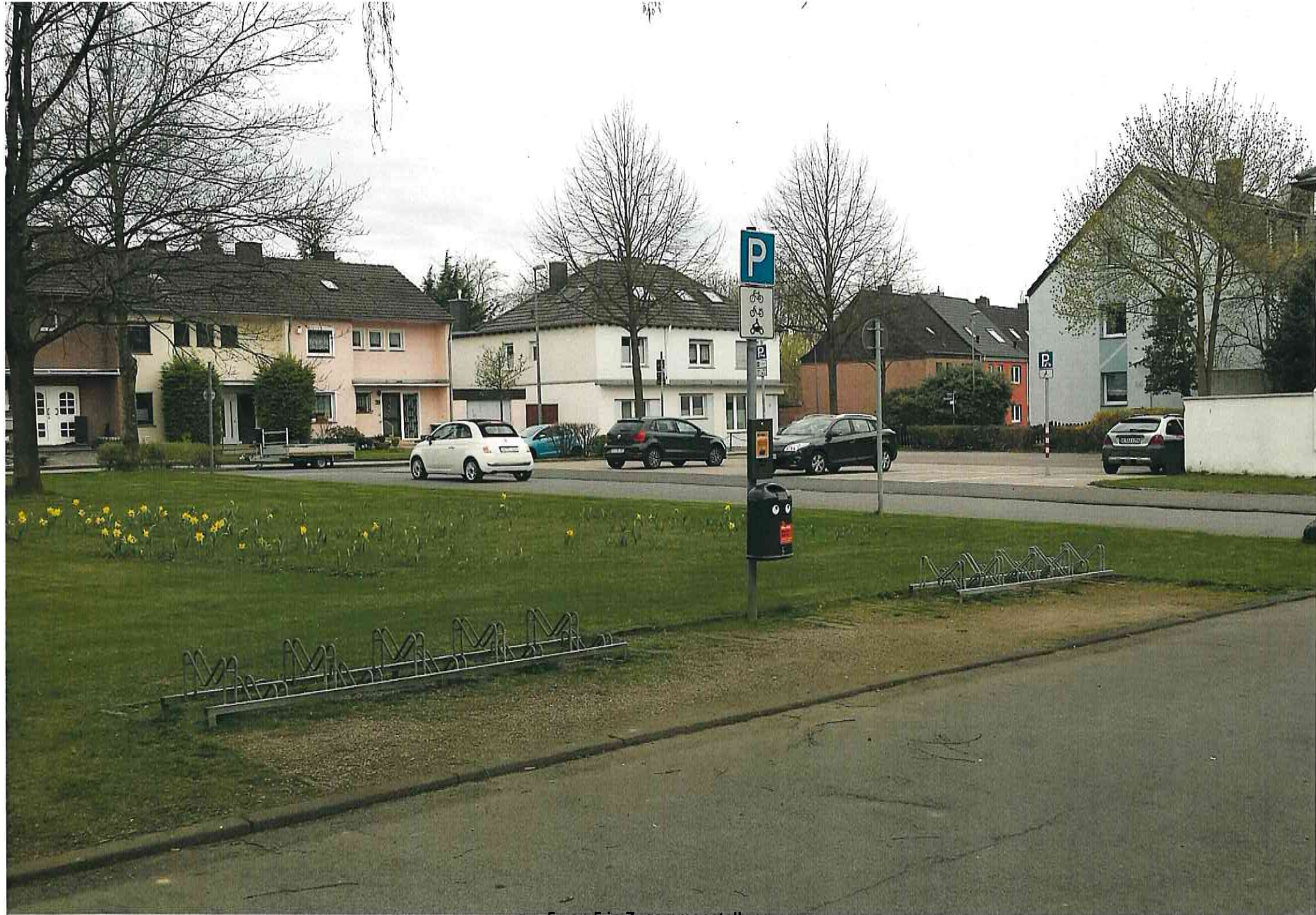
5 von 5 in Zusammenstellung