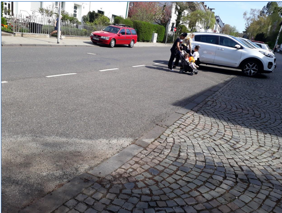
Bringen/Abholen Kita, Kalverbenden