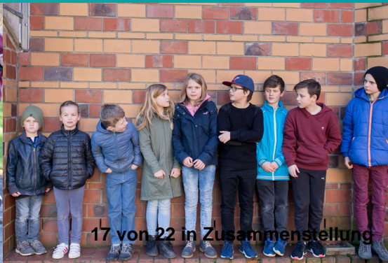
17 von 22 in Zusammenstellung