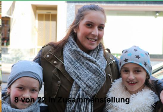
8 von 22 in Zusammenstellung