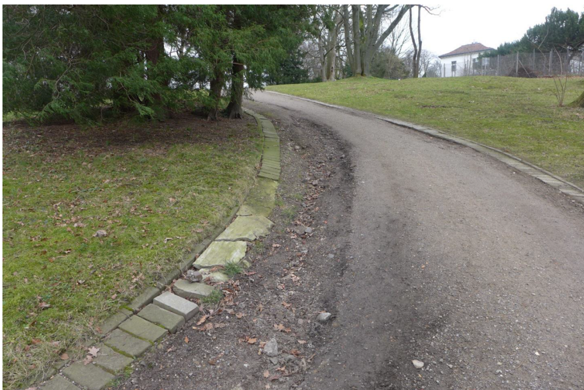
Abb. 1: Beispiel für schadhafte wassergebundene Decke, Einfassung und Entwässerung außer Funktion

Während der Bestandsaufnahme des Parkpflegewerks wurde erneut deutlich, dass vor allem in den zahlreichen Hanglagen durch Ausspülungen immer wieder Schäden an unbefestigten Wegeoberflächen entstehen. Diese verursachen einen wiederkehrend hohen Unterhaltungsaufwand und damit verbunden kontinuierliche Kosten.