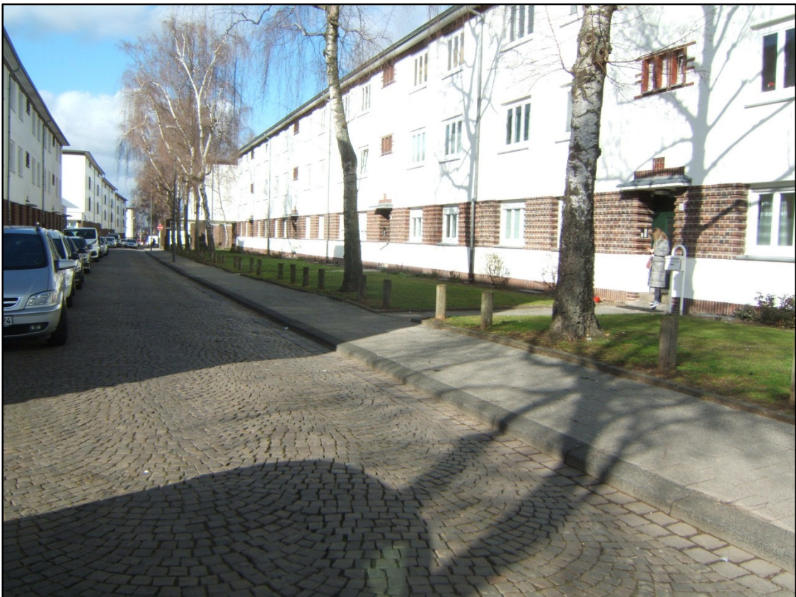
Lützowstraße: bestehender Vorgartenbereich vor Hausnr 19-25