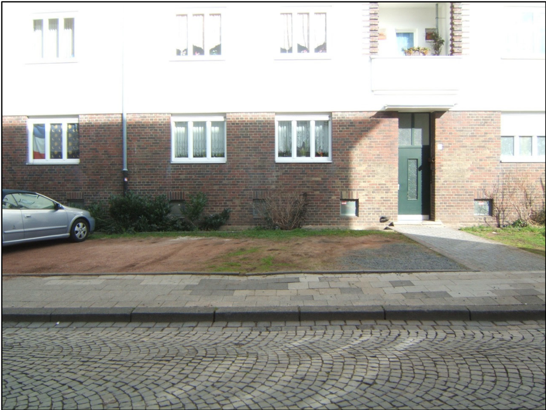
Lützowstraße: widerrechtliche zum Parken genutzte Vorgartenfläche vor Haur. 11 mit Schäden am Gehweg