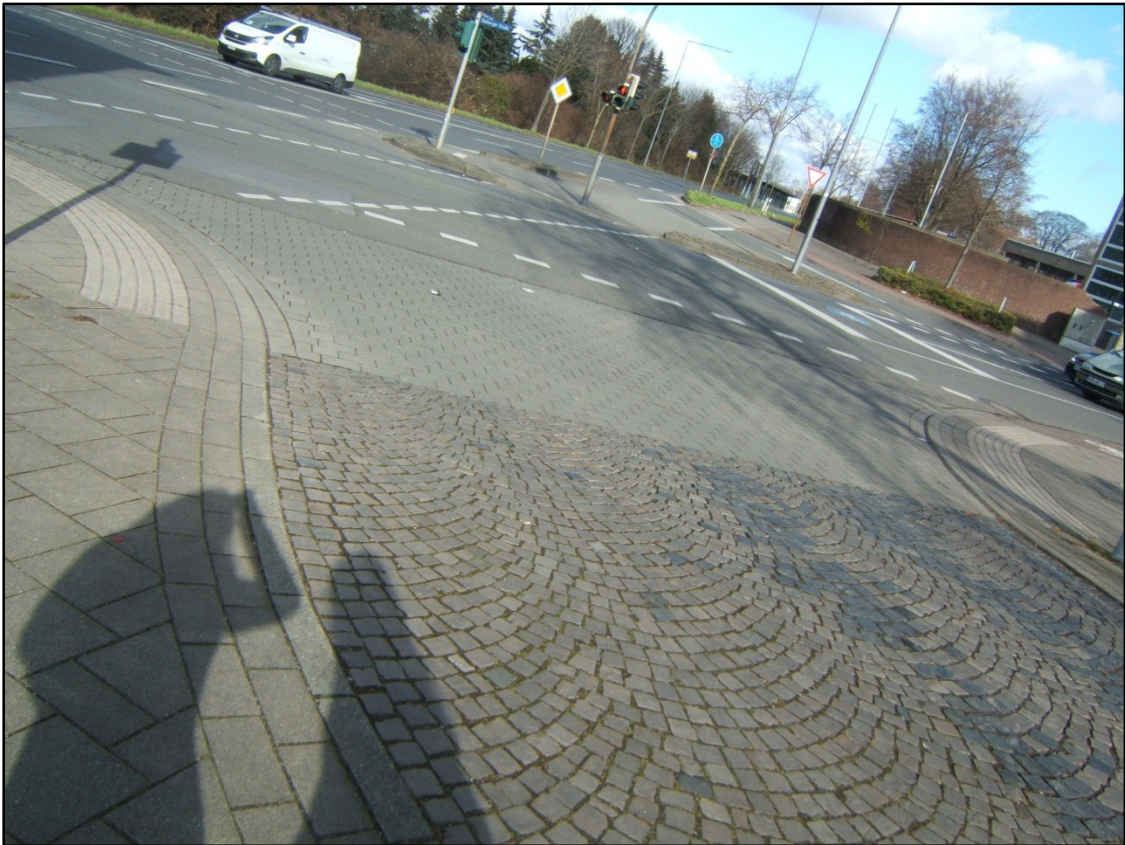
Einmündungsbereich Lützowstraße/Stolberger Straße