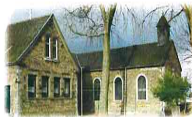
VR 5899 Amtsgericht Aachen

- Verein zur Förderung der Kapelle Allerheiligste Dreifaltigkeit -