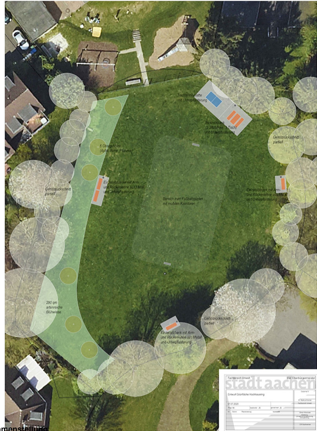
Entwurfplan Maßstab 1:100