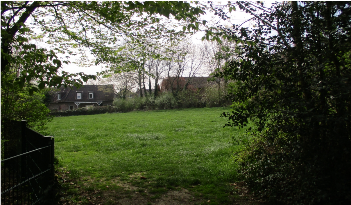
Grünfläche am Hochhausring April 2020

Ideen und Anregungen für die weitere Arbeit am Entwurf vom Fachbereich Umwelt entgegengenommen.