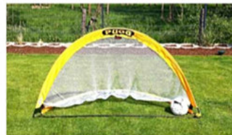
Kleine mobile Fußballtore