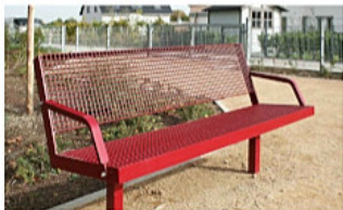
Fußball gestahelte Sitzbank