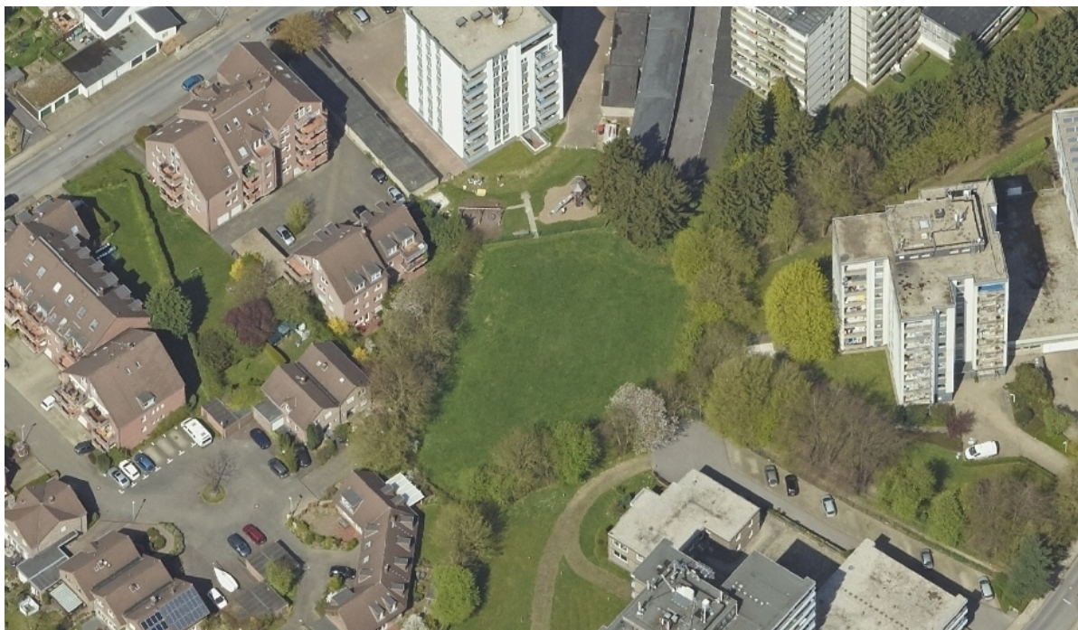
Luftbildaufnahme der Grünfläche am Hochhausring

Die extensiv genutzte, 2.300 m 2 große öffentliche Grünfläche am Hochhausring in Aachen-Walheim weist bis auf eine Rasenfläche, rahmende Baumstrukturen und freiwachsende Hecken keine freiraumplanerische Gestaltung auf. Sie wird derzeit überwiegend als Freilaufwiese für Hunde genutzt.