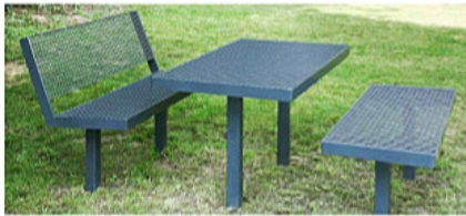
Sitzbank-Tisch-Kombi aus Metall