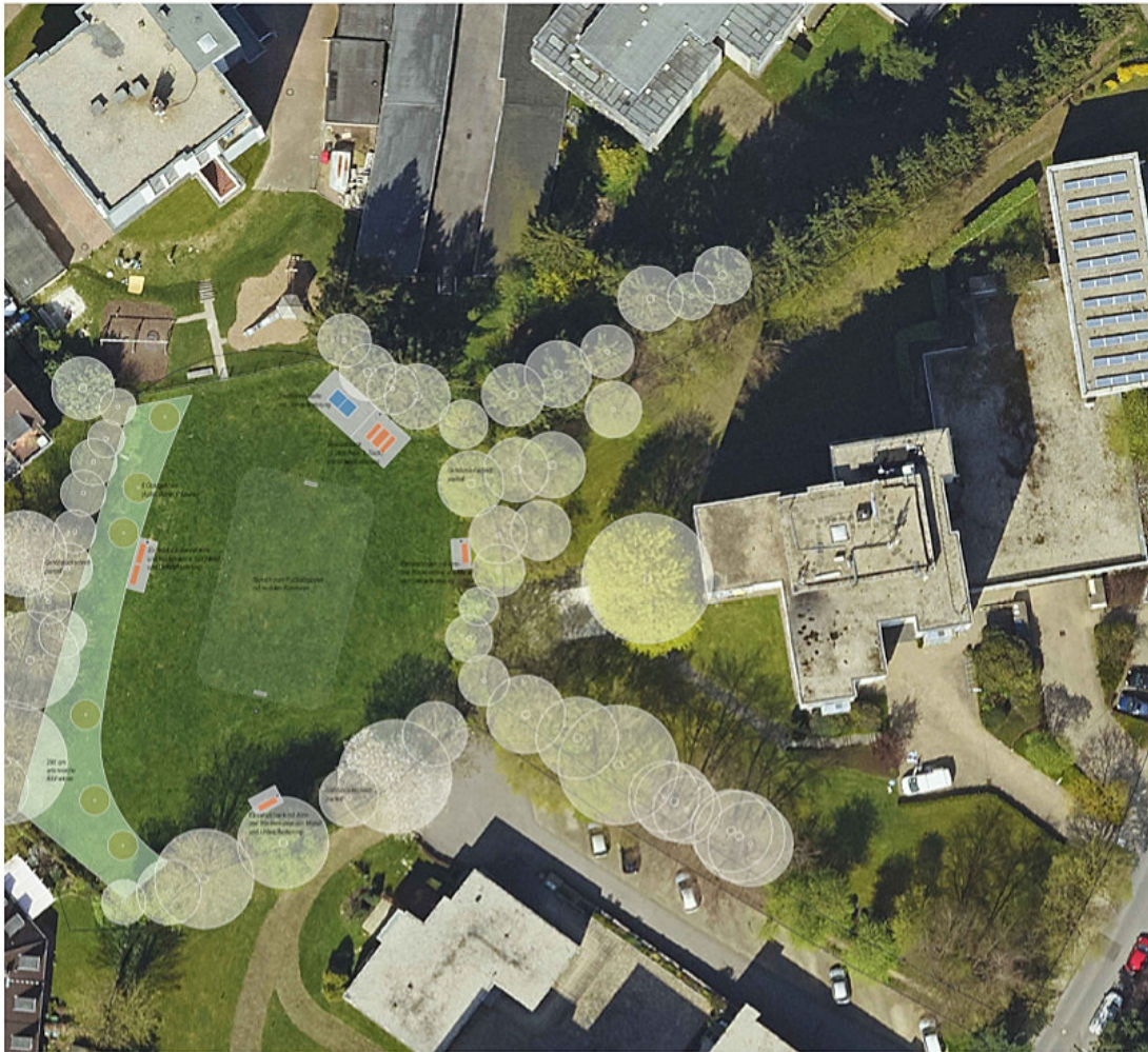
Entwurfplan Maßstab 1:200