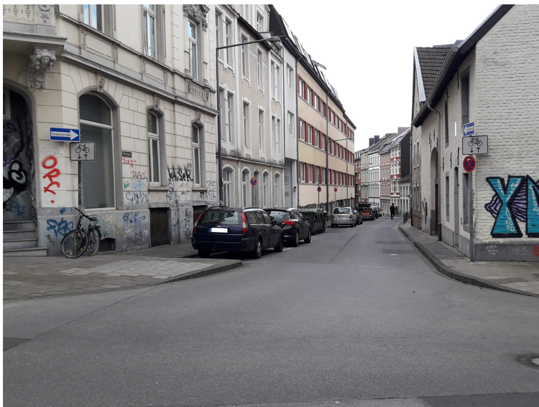
Stromgasse; Einmündungsbereich Hunbertusplatz / Hubertusstraße