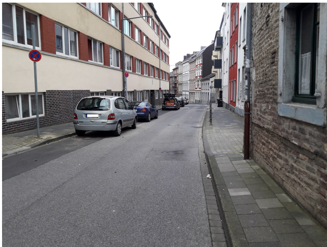
Stromgasse in Richtung Rosstraße; Engstelle vor Hausnr. 41