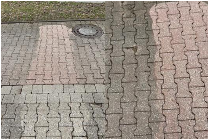
Abbildung 2: Gereinigte Pflasterfläche - Trockenzustand