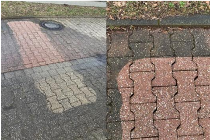
Abbildung 1: Gereinigte Pflasterfläche - Nasszustand

Nachgang negativ beeinträchtigen könnte. Die Kosten für eine Reinigung von Geh- und Radweg sowie die Nachverbesserung der Verfugung betragen rd. 19.000,- € (brutto).