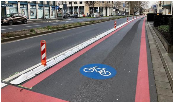
Abbildung 3: Markierung Radweg

Alternativ könnten als Ergänzung zu dem bestehenden rötlichen Pflaster eine seitliche rote Markierung aus Kaltplastik aufgebracht (vgl. Abbildung 3) werden. Zusätzlich wird empfohlen, unabhängig von der Variante Piktogramme auf den Radweg aufzubringen, um die Trennung zwischen Geh- und Radweg hervorzuheben. Die Kostenschätzung für diese Markierungsarbeiten beträgt rd. 11.000,- € (brutto).