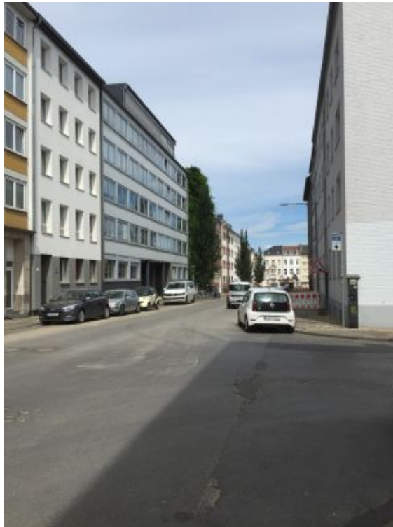
Alfonsstraße ( Richtung Augustastr. )

Im Jahr 2010 wurden in der Alfonsstraße bereits drei Baumstandorte hergestellt. Sie befinden sich im Abschnitt Augustastraße bis Einmündung Luisenstraße, rechtsseitig, vor den Häusern Alfonsstraße Nr.8, Nr. 18 und Nr.28.