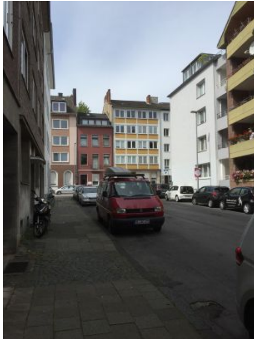
Luisenstraße ( Richtung Alfonsstraße )

In der Luisenstraße, im Abschnitt Alfonsstraße bis Kreuzung Friedrichstraße, werden ebenfalls Ver- und Entsorgungleitungen durch die Regionetz neu verlegt. Neben den rund um den Kreuzungsbereich Friedrichstraße – Luisenstraße angeordneten Bestandbaumstandorten gibt es vor Haus Luisenstraße Nr.8 und seitlich Haus Friedrichstraße Nr 60 ( Ende Parkstreifen) zwei sehr kleine, zurzeit baumlose Baumscheiben. Diese beiden Standorte werden aufgegeben und zu Gunsten von zwei neuen optimierten Baumfeldern vor Haus Luisenstraße 3 und seitlich Haus Alfonsstraße Nr.23 ersetzt.