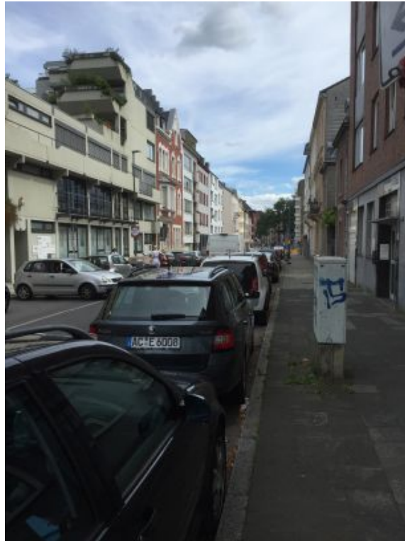
Augustastraße ( Richtung Friedrichstraße. )

Der Fachbereich Umwelt nimmt diese Baumaßnahme zum Anlass, die drei mit öffentlichem Grün unterversorgten Straßenräume durch insgesamt zwölf neue Baumstandorte aufzuwerten. Die Straßen liegen in der im Klimafolgenanpassungskonzept ausgewiesenen Mehrfachbelastungszone. Hier ist es eine zentrale Notwendigkeit, das Lokalklima u.a. durch Reduzierung des Versiegelungsgrades und die Erhöhung des Grünanteils zu verbessern.