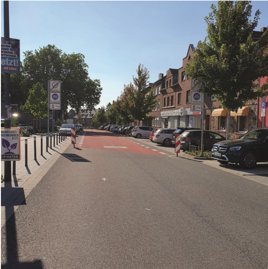
Marktstraße – Beginn RVR Brand