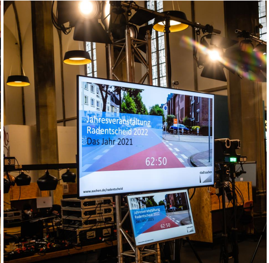
Eindrücke aus der Jahresveranstaltung Radentscheid in Aachen 2021