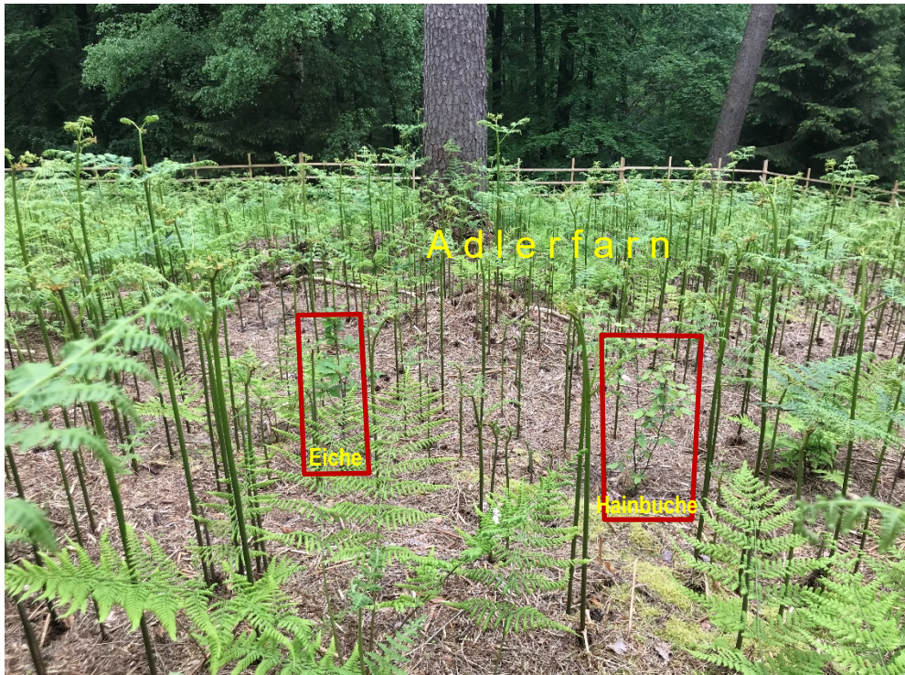
Eichenkultur mit aufkommendem Adlerfarn, vor dem Freischnitt (22.05.2023)

Die Pflicht zur Wiederaufforstung geht mit der Verpflichtung einher, diese Investitionen zu pflegen und zu schützen (§ 44 (2) LFoG). In diesem Zusammenhang werden Forstkulturen manuell mit Sense oder Freischneider freigeschnitten, sofern die Konkurrenzvegetation (meist Adlerfarn und Brombeere) dominiert und die Kultur gefährdet. Geplant ist ein zweimaliger Freischnitt auf rund 26 ha.