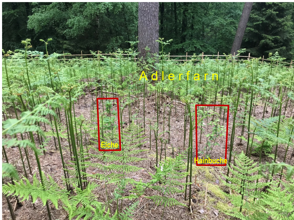
Eichenkultur mit aufkommendem Adlerfarn, vor dem Freischnitt (22.05.2023)

Die Pflicht zur Wiederaufforstung geht mit der Verpflichtung einher, diese Investitionen zu pflegen und zu schützen (§ 44 (2) LFoG). In diesem Zusammenhang werden Forstkulturen manuell mit Sense oder Freischneider freigeschnitten, sofern die Konkurrenzvegetation (meist Adlerfarn und Brombeere) dominiert und die Kultur gefährdet. Geplant ist ein zweimaliger Freischnitt auf rund 1,4 ha.