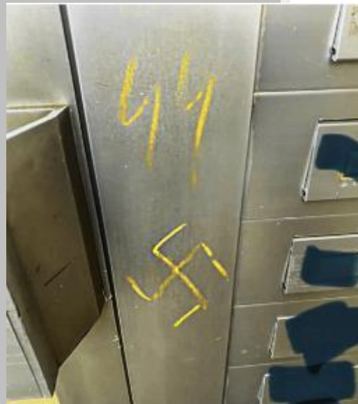
„An meiner Haustür“, schrieb der Grünen-Politiker bei Facebook zu diesem Foto. Doch Hakenkreuz und SS-Runen hatte er selbst gemalt

2. SEPTEMBER 2022 UM 12:01 UHR | 1 Minute, 2 Minuten