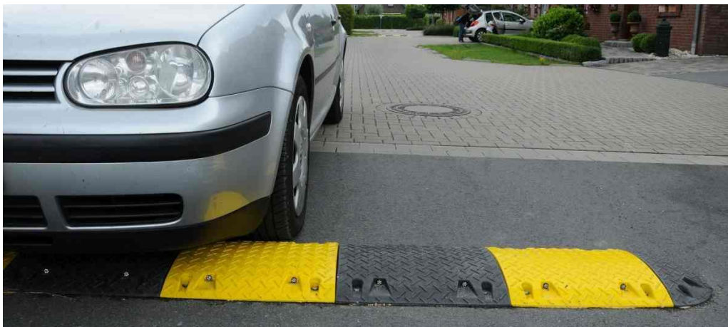
Abbildung 2: Bremsschwellen