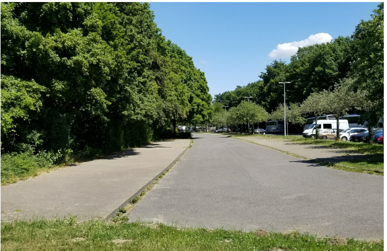
Stellplätze rechts und links der Fahrgasse aus Richtung Zufahrt