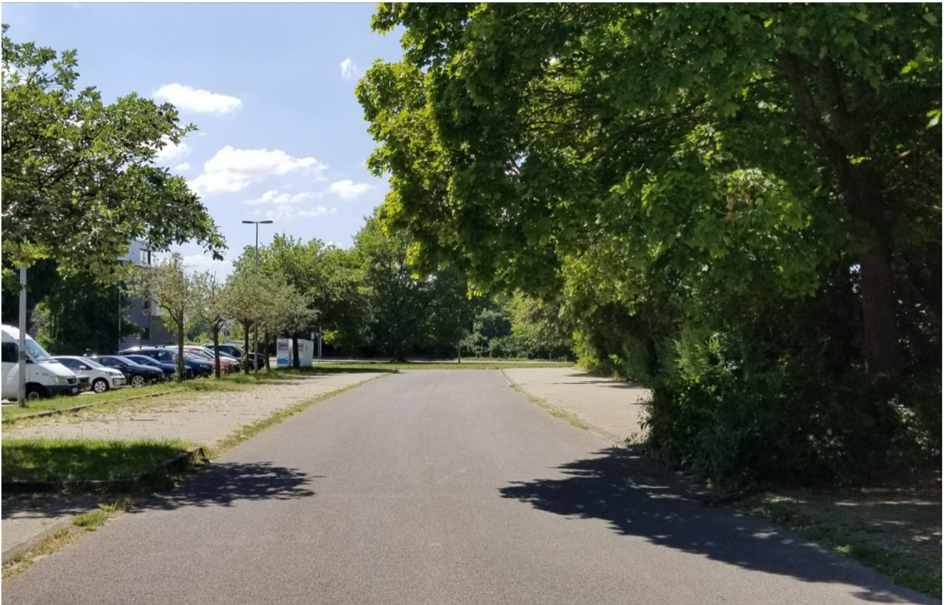
Stellplätze rechts und links der Fahrgasse aus Richtung Ausfahrt