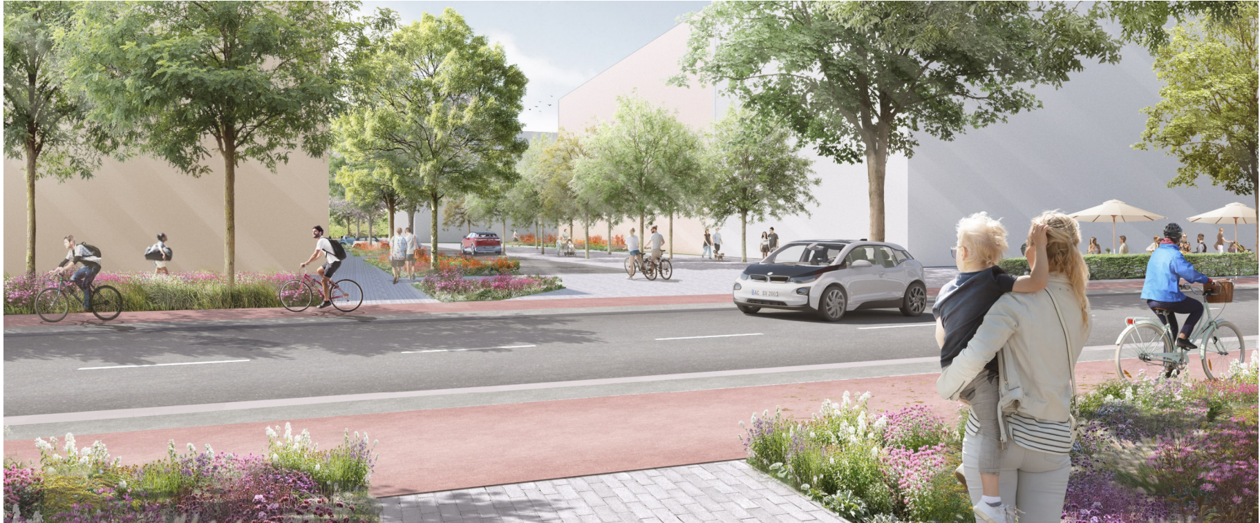
Visualisierung: Willner Visualisierung