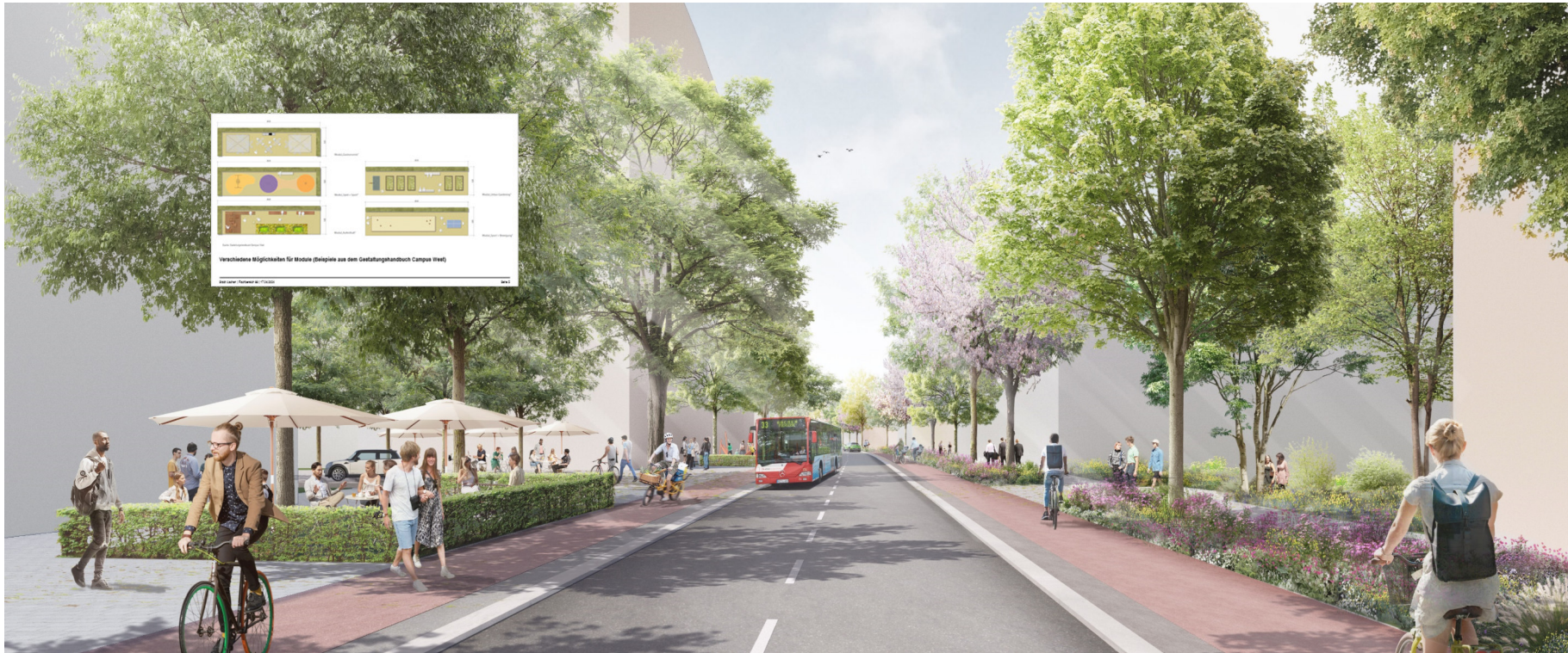
Visualisierung: Willner Visualisierung