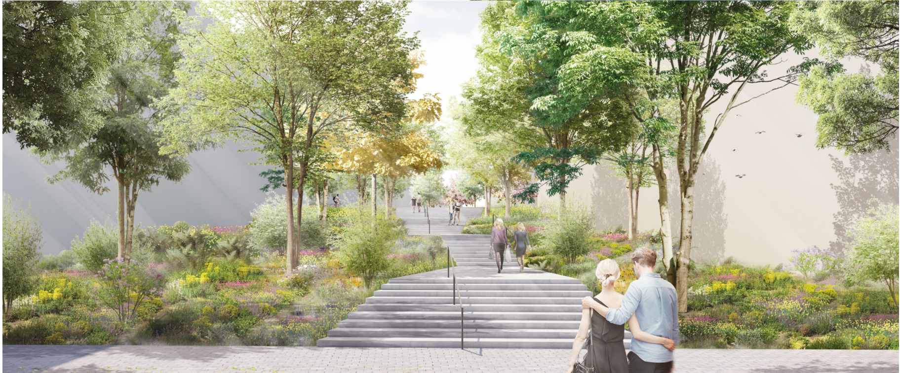
Visualisierung: Willner Visualisierung