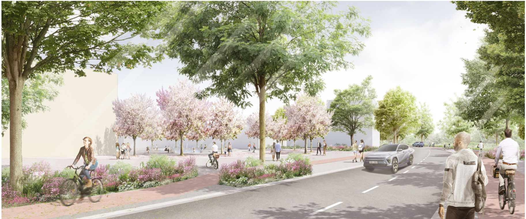
Visualisierung: Willner Visualisierung