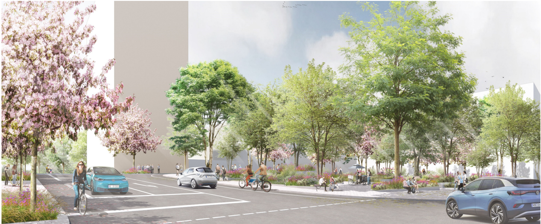
Visualisierung: Willner Visualisierung