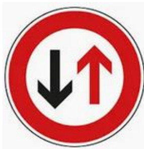
in Fahrtrichtung „Alt-Haarener-Straße“

Aufgrund der zunehmenden Verkehrsdichte im Bezirk hat ebenfalls die Belastung rund um die Friedenstraße zugenommen. Insbesondere an der Verengung in der Friedenstraße am Gerätehaus der freiwilligen Feuerwehr (Löschzug Haaren) ist mit täglichen Staus zu rechnen. Um die Verkehrssituation zu entlasten, bitte wir die zuständige Fachverwaltung zu prüfen, ob die Möglichkeit besteht die Vorfahrt an der Verengung wie folgt zu regeln und damit Rückstaus, die zu einer Verstopfung der Verengung führen, zu vermeiden. Wir bitten daraufhin die Aufhängung der Schilder zu veranlassen.