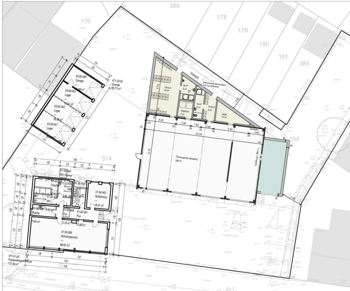
Erdgeschoss, ohne Maßstab