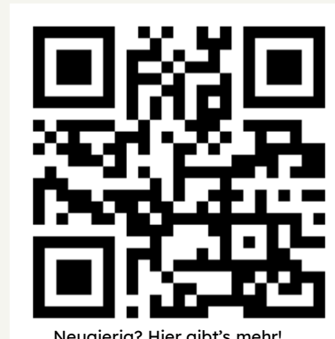
Neugierig? Hier gibt's mehr!