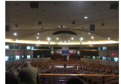
Besuch EU-Parlament, JuLis Aachen, Mai 23