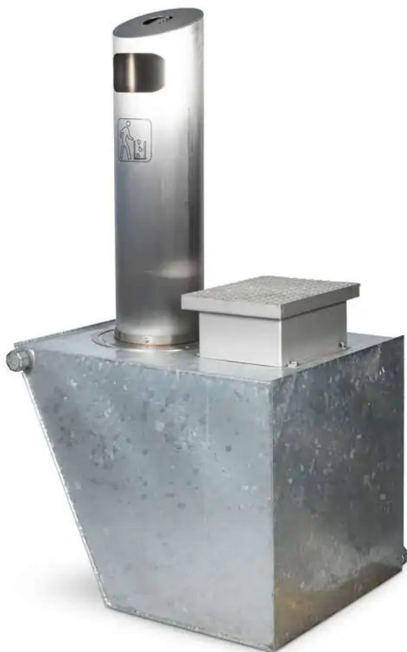
Abbildung 1: Unterflurbehälter, Modell wie in der Aachener Fußgängerzone eingesetzt