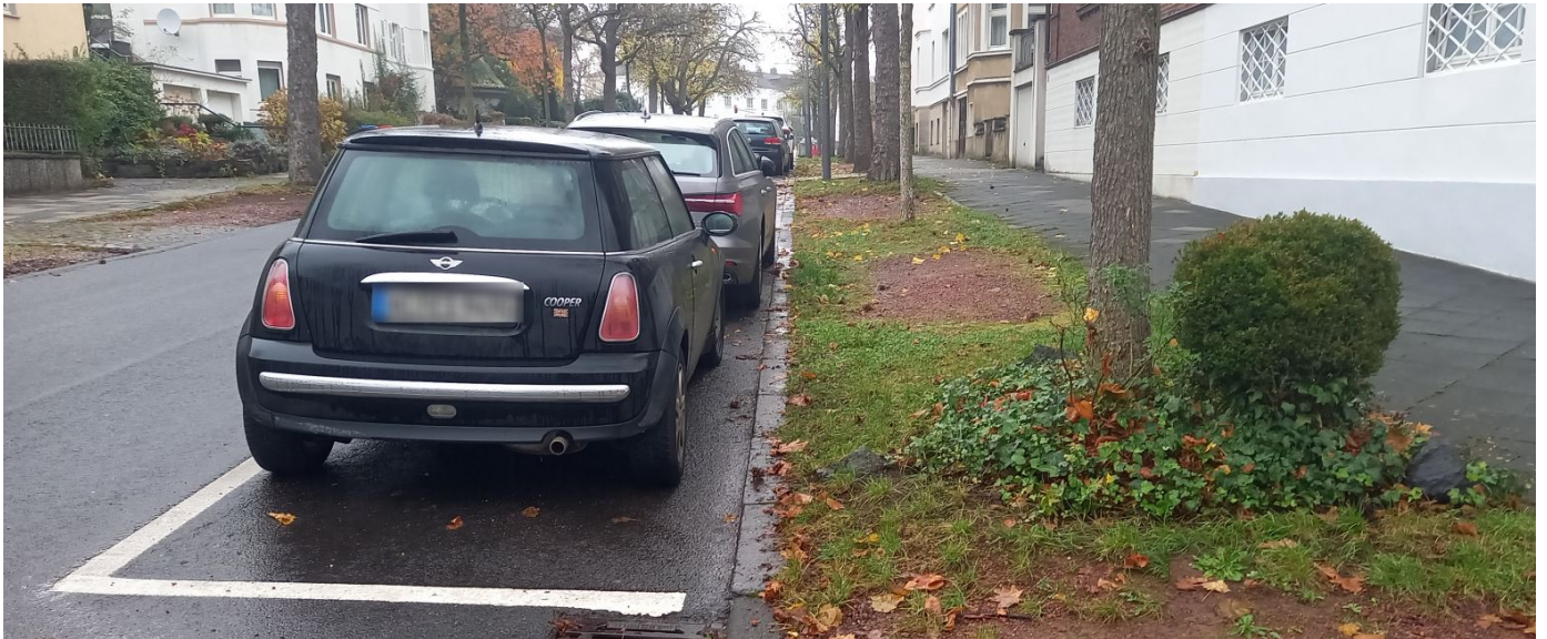
Limburger Straße, Zustand nach Einrichtung der Bewohnerparkzone