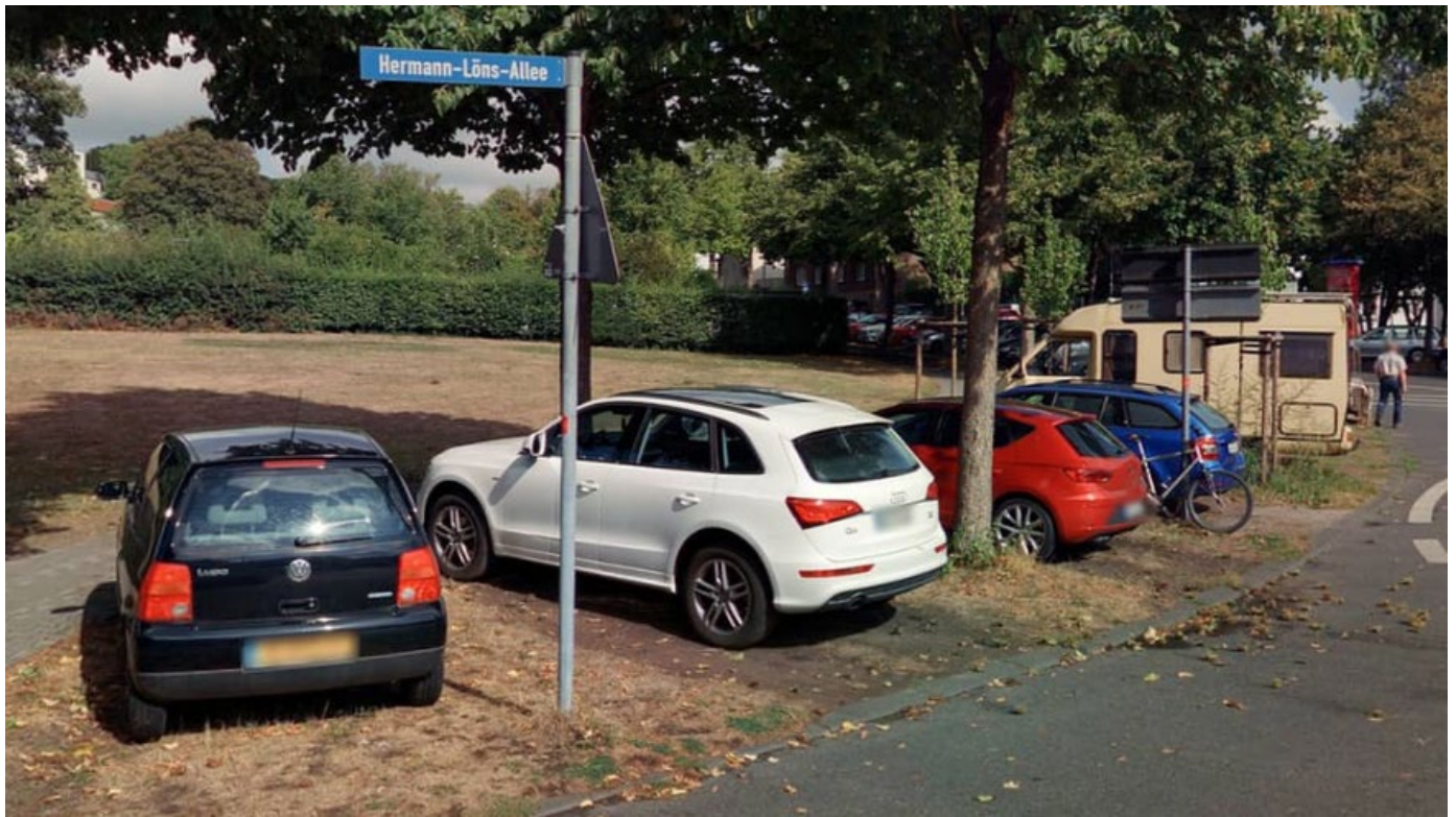
Sariyer-Platz / Hermann-Löns-Allee, Zustand vor Umsetzung von Schutzmaßnahmen