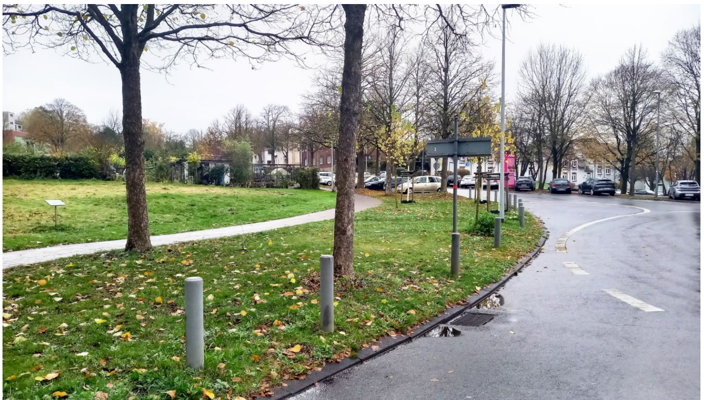
Sariyer-Platz / Hermann-Löns-Allee, Zustand nach Umsetzung von Schutzmaßnahmen und ergänzenden Baumpflanzungen