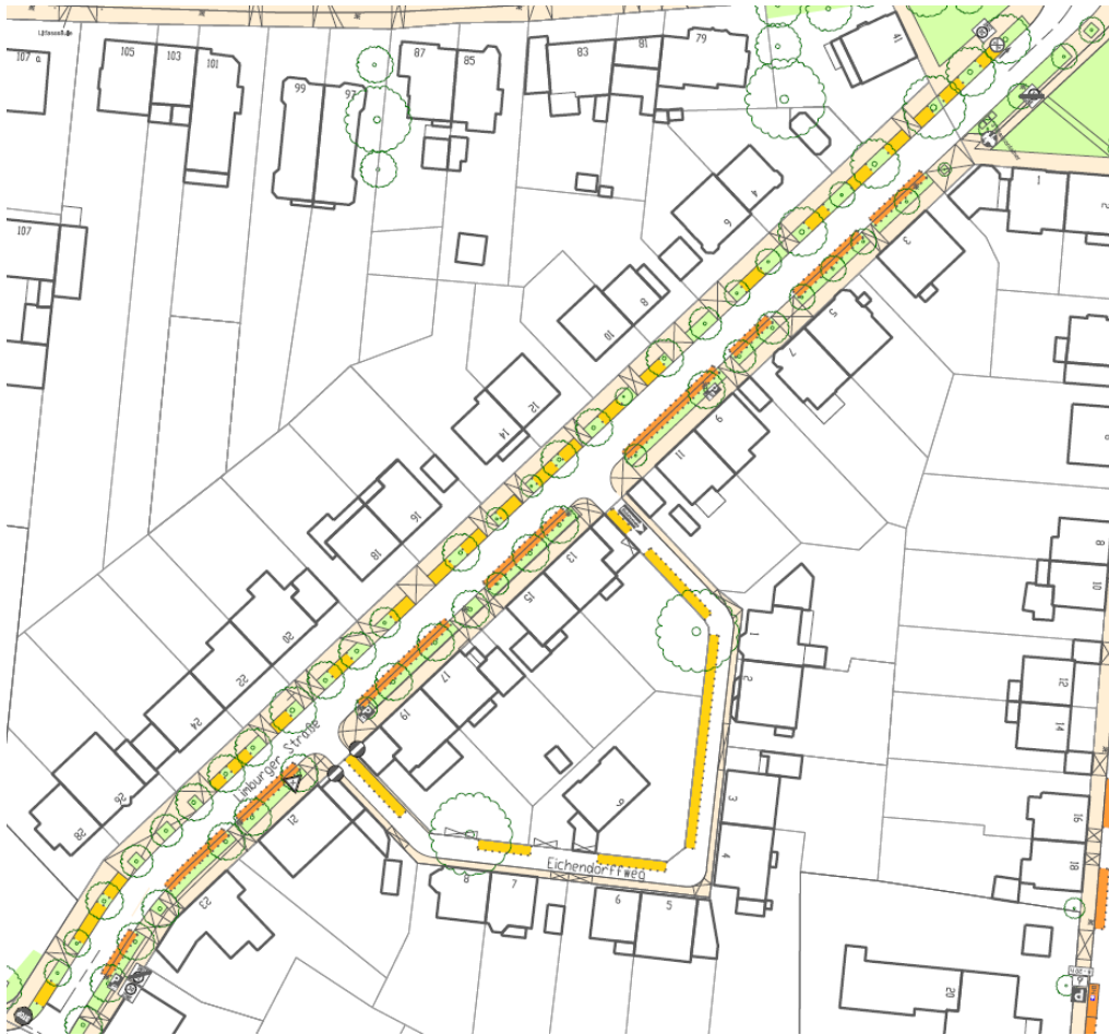
Bewohnerparkzone 'U' – Bestand, Auszug Limburger Straße