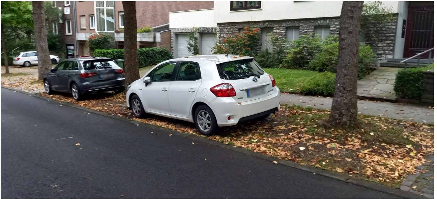
Limburger Straße, Zustand vor Einrichtung der Bewohnerparkzone