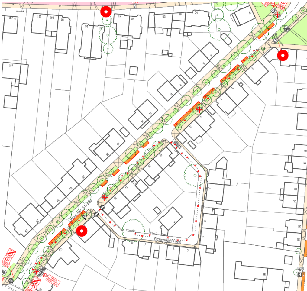
Bewohnerparkzone 'U' – Planung, Auszug Limburger Straße