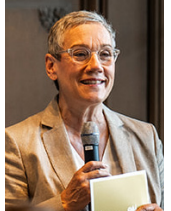
Sibylle Keupen Oberbürgermeisterin für Aachen

Ich freue mich darauf, diesen Weg gemeinsam mit Ihnen weiterzugehen.