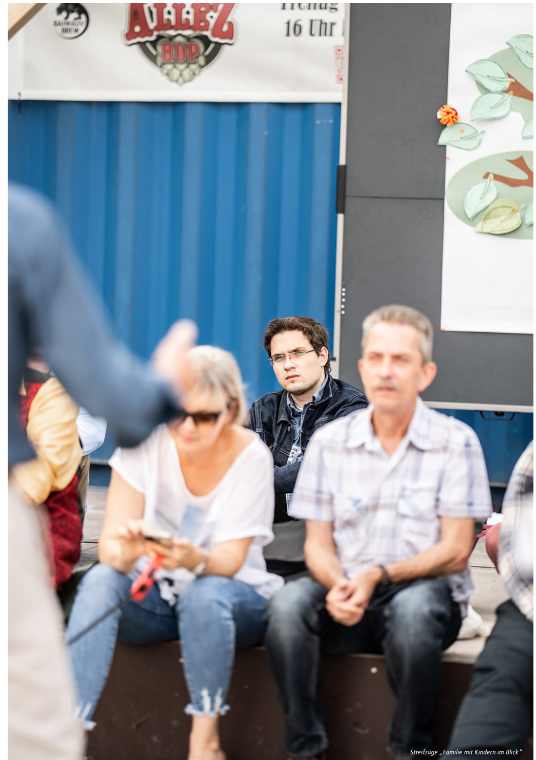
Streifzüge „Familie mit Kindern im Blick“

Die Mitglieder des Bürger*innenrats haben sich Gedanken zum weiteren Umgang mit ihren Empfehlungen gemacht und Vorschläge formuliert, die als Anregungen und Wünsche zu verstehen sind. Diese erfolgten ohne detaillierte Einblicke in spezifische Abläufe der Verwaltung oder Zuständigkeiten.