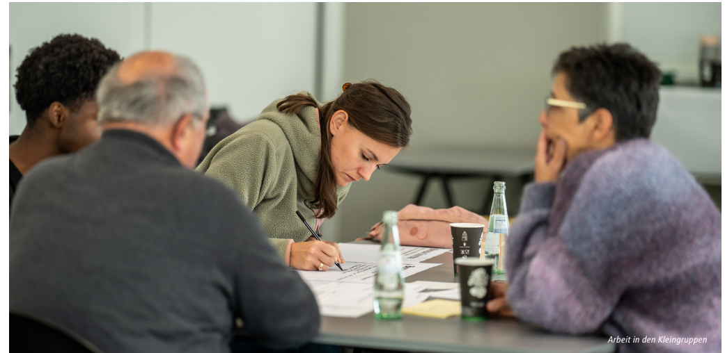
Arbeit in den Kleingruppen

Querschnittsthemen: Das Vorhaben stärkt die Querschnittsthemen Nachhaltigkeit, Inklusion, soziales Miteinander, Beteiligung und Teilhabe.