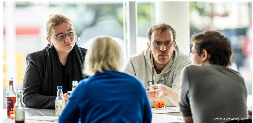
Arbeit in den Kleingruppen