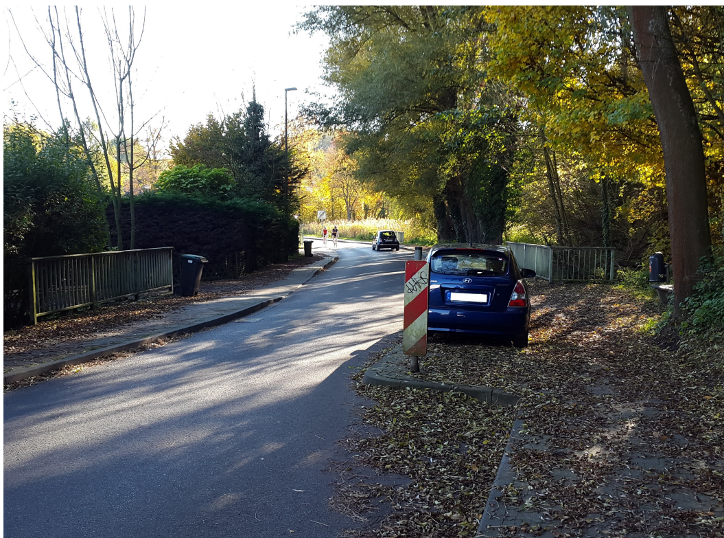
Untere Brunnenstraße, Fahrtrichtung Schurzelter Straße