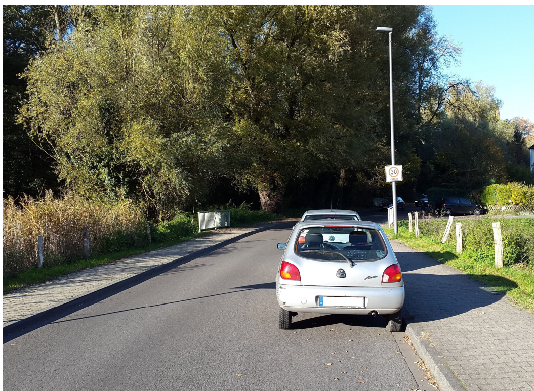
Untere Brunnenstraße, Fahrtrichtung Rathausstraße