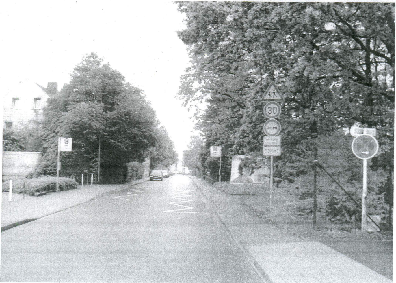
... und aus Richtung Im Fuchsbau