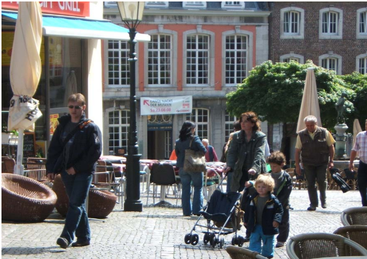
Fachbereich 61/201 Team Verbindliche Bauleitplanung

Ziel: Sicherung und Verbesserung der konkreten Lebensbedingungen der Familien in der Stadt Aachen