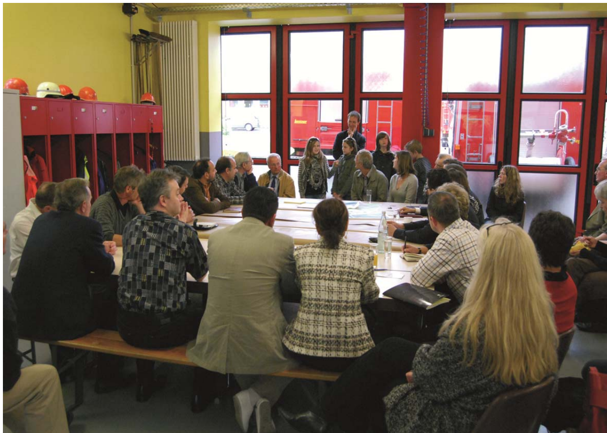
Fachbereich 61/201 Team Verbindliche Bauleitplanung

Ziel: Zufriedene Bewohnerinnen und Bewohner der Stadt Aachen, insbesondere wenn Familien, Kinder und Jugendliche an der Entwicklung ihres Lebensumfeldes beteiligt werden.