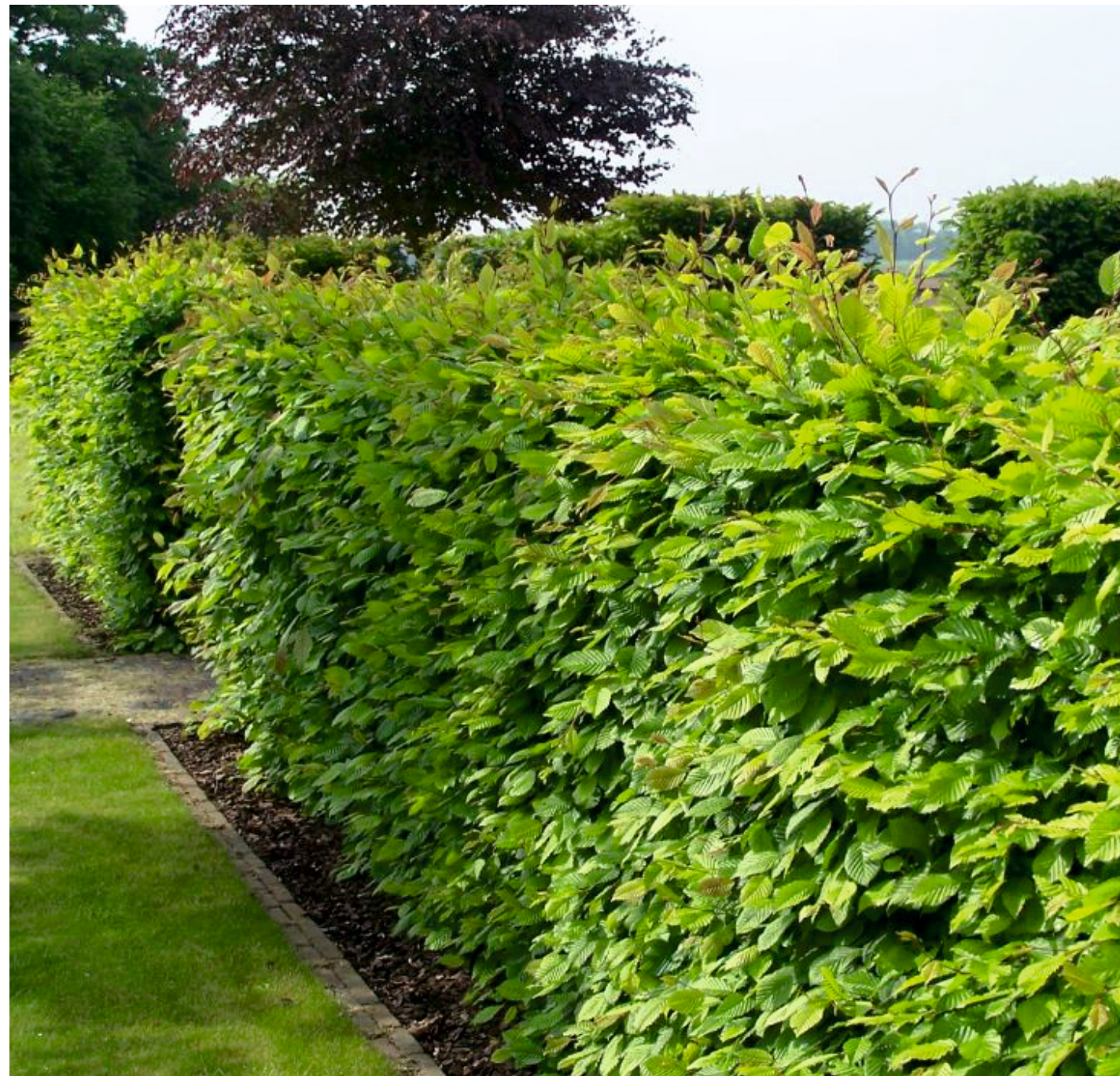
Hainbuchenhecke ( Carpinus betulus ), Höhe: ca. 1 m