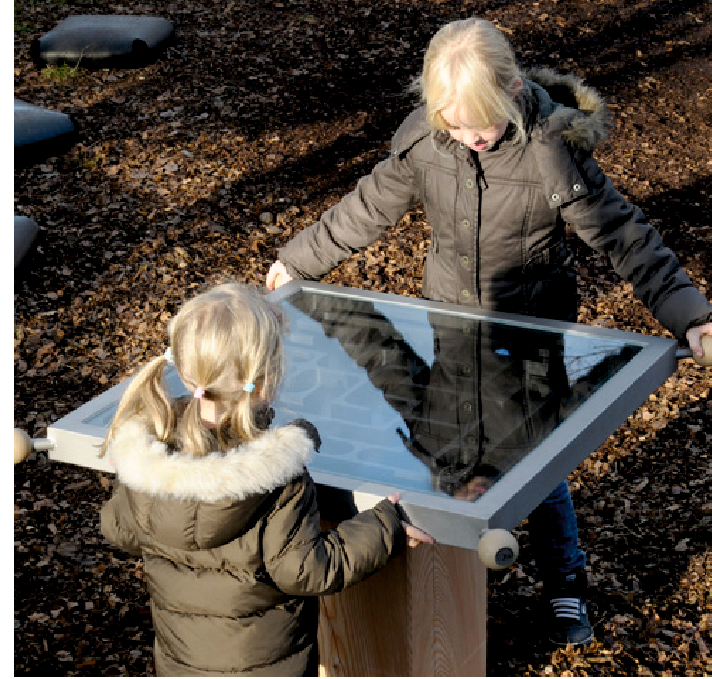
Spieltisch Kugellabyrinth fördert Geschicklichkeit, Koordination und Geduld