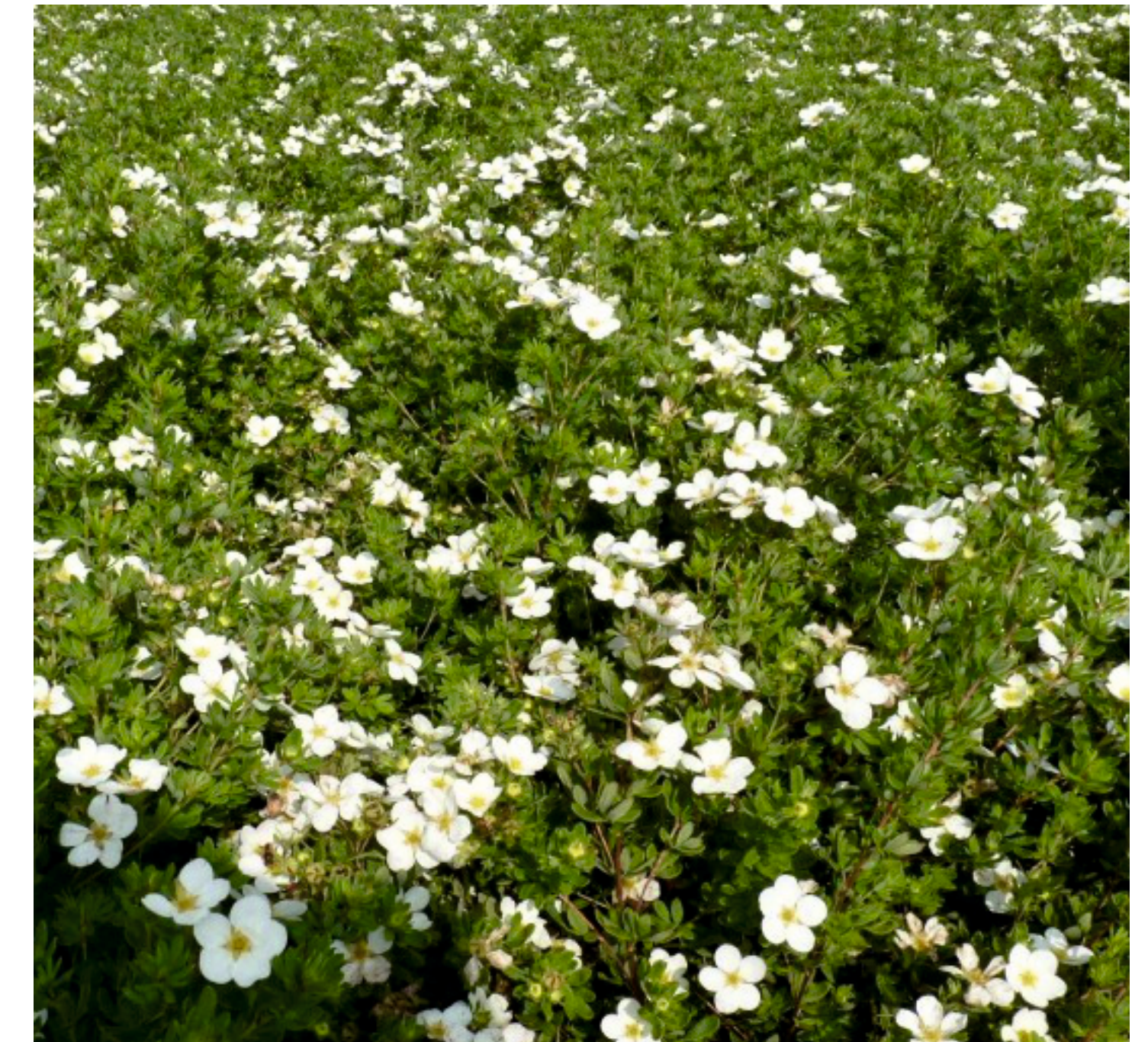
Fingerstrauch ( Potentilla fruticosa 'Abbotswood' und 'Manchu')