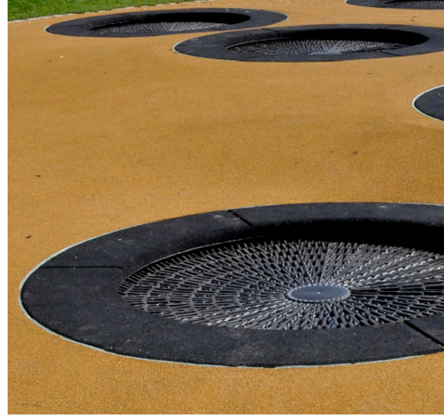
Trampoline (Sprungfläche Ø 1,30 m) mit Fallschutzplatten und fugenlosem Gummi-Fallschutzbelag