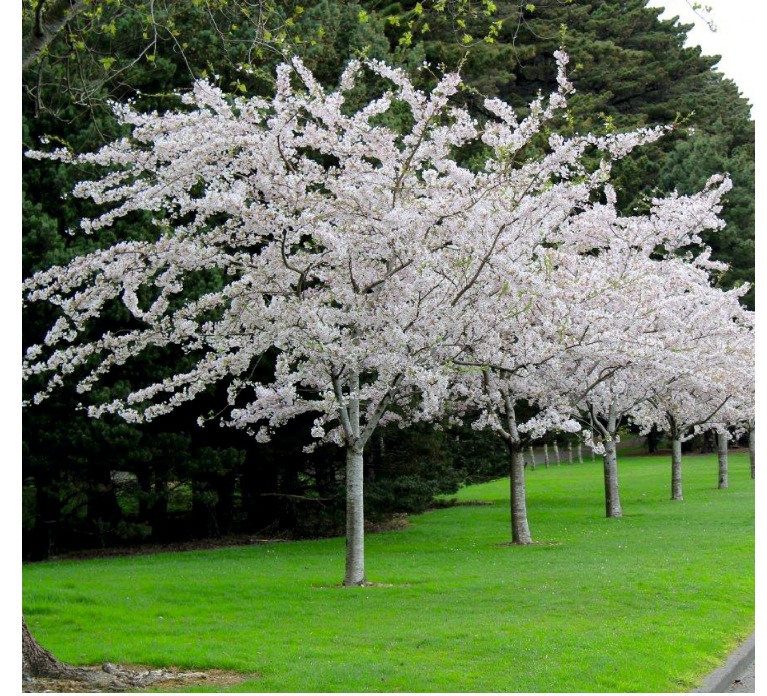
Kleinbaum Tokyo-Kirsche ( Prunus x yedoensis )