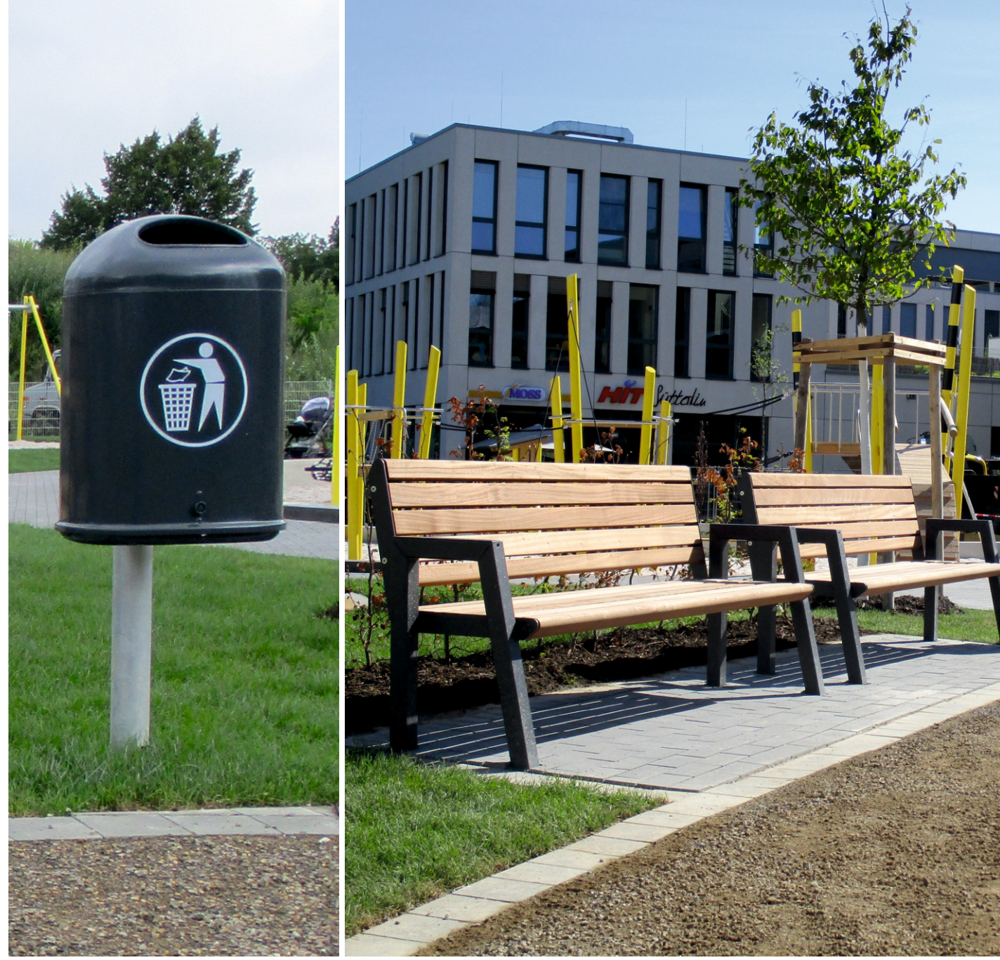
Abfallbehälter (ESE) und Sitzbank (Modell: Quater, Westeifelwerke)