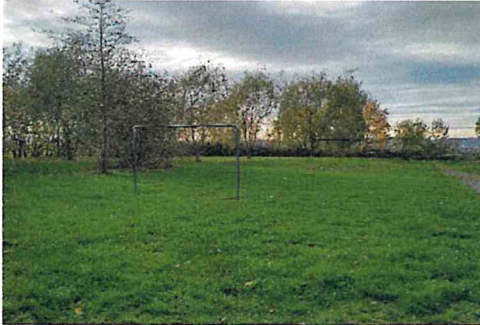
Nur noch Attrappe: Der Bolzplatz ist nicht mehr bespielbar.

Der Grillplatz am Heider-Hof-Weg ist gefragt. Zwischen den Frühling- und Herbstmonaten ist er an den meisten Wochenenden ausgebucht. Reservierungen finden auch unter der Woche statt. Zur Ferienzeit ist auf dem Platz beinahe täglich Betrieb.