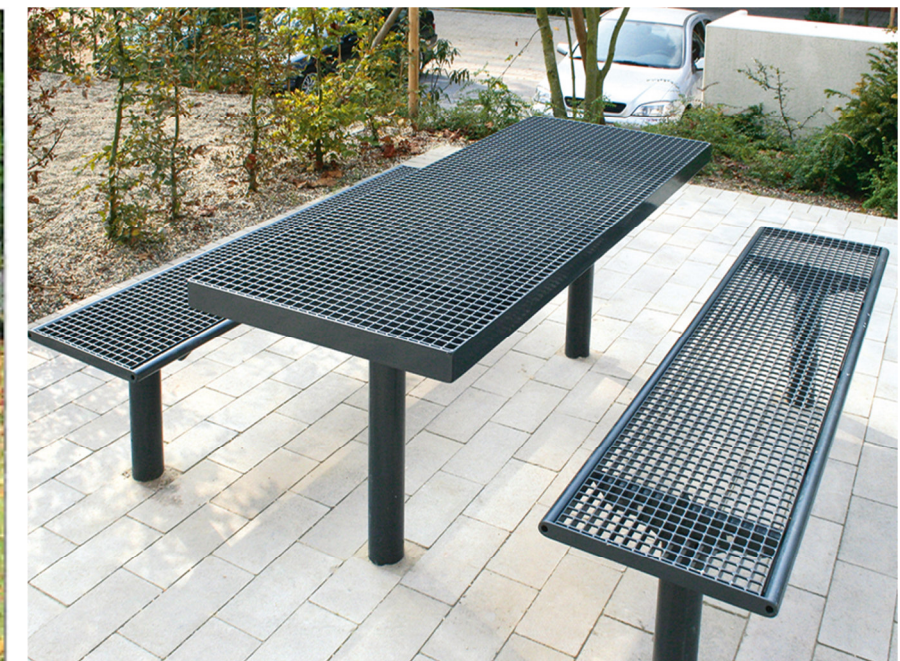
Picknick-Kombination (Ausführung mit blauen Bänken)