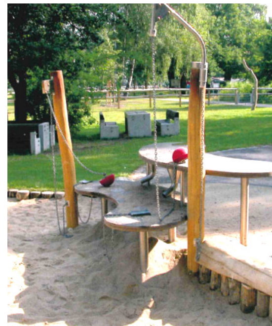
Sandtisch für Rollstuhlfahrer