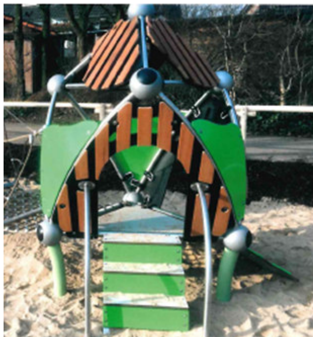
Kleinkindspielhaus mit Rutsche