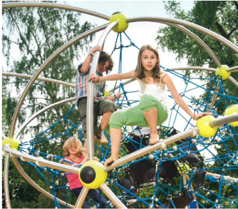
Seilklettergerät mit Anbaurutsche