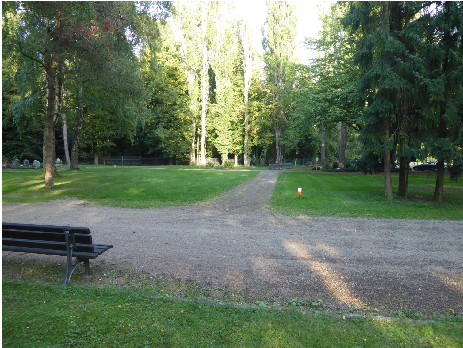
Friedhof Nirmer Straße Flur 11