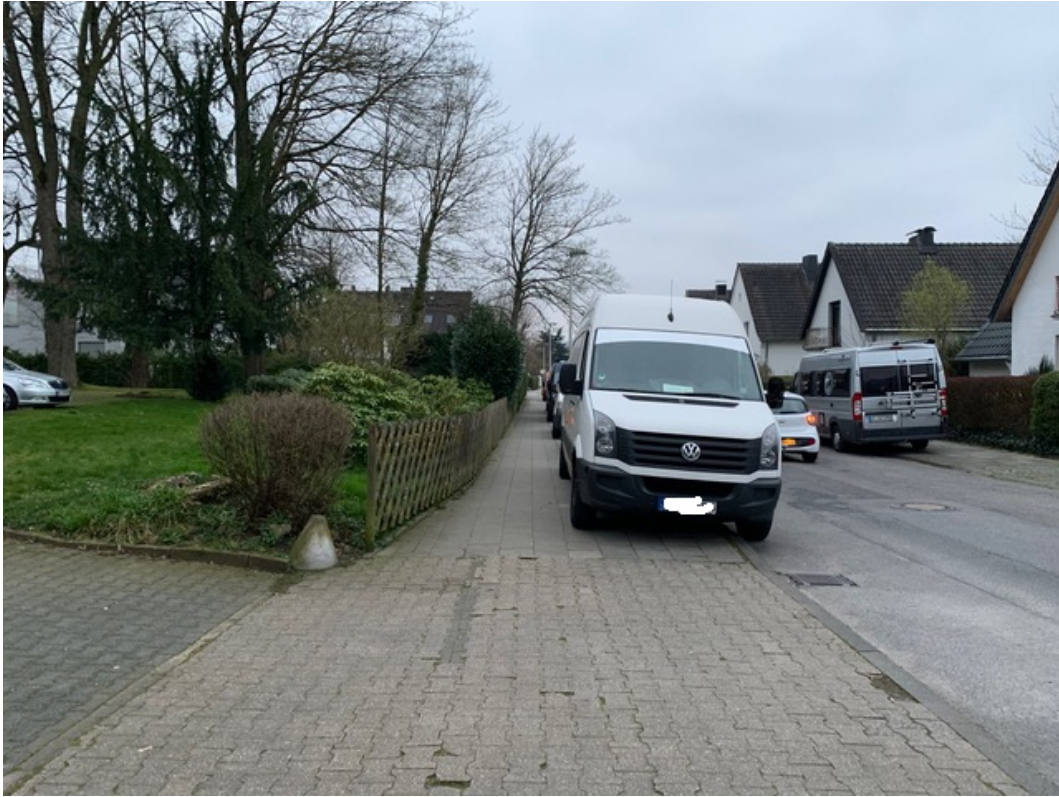
Schönrathstraße (südliche Straßenseite)