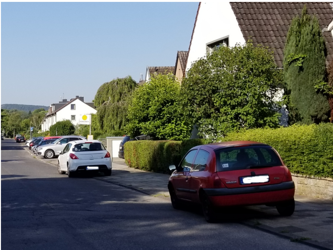
Schönrathstraße (nördliche Straßenseite)