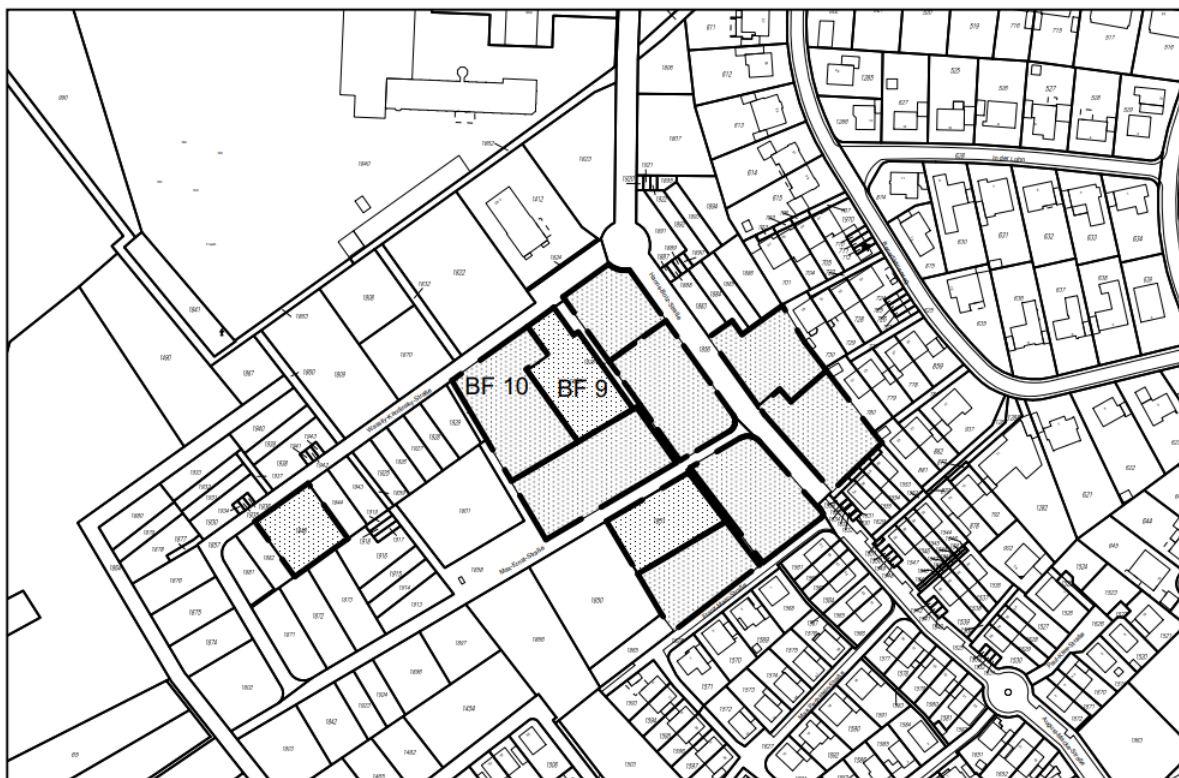
Lage im Plangebiet

Die Baufelder 9 und 10 sollen als „Experimentierfeld“ für kreative und innovative Ansätze mit Vorbildfunktion im Bereich des Einfamilienhausbaus mit besonderen architektonischen, ökologischen und energetischen Standards ausgeschrieben werden. Mit dem Konzeptverfahren sollen sowohl professionelle Investierende wie auch Baugemeinschaften angesprochen werden und damit den Akteurskreis erweitern, um eine Hausgruppe mit maximal 11 Wohngebäuden zu realisieren.