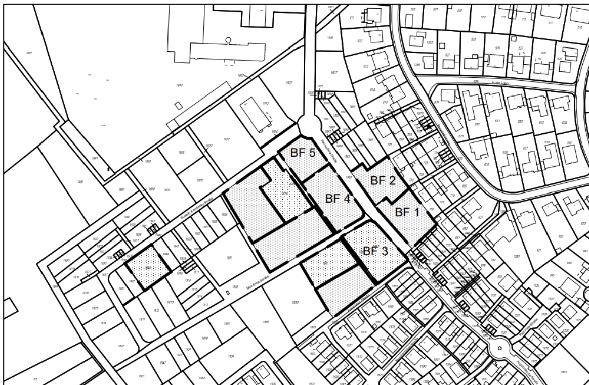
Lage im Plangebiet

Mit dem Konzeptverfahren I wird öffentlich geförderter Wohnraum auf den Baufeldern 1-5 ausgeschrieben.