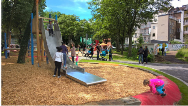
Ein Gebäude weicht, ein Quartierspark entsteht