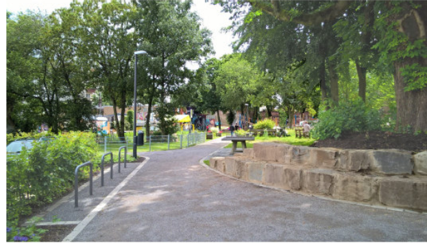
Neue Öffnungen, neues Grün auf einem entsiegelten Parkplatz