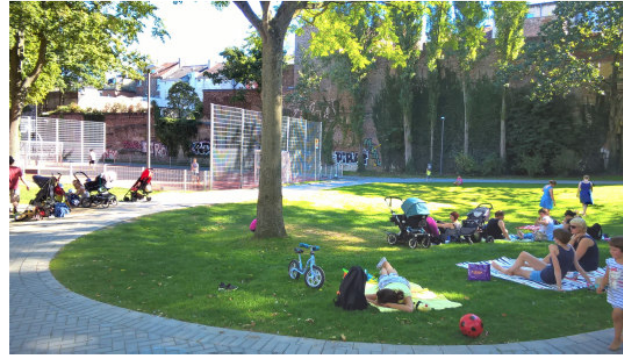
Eine Oase in der Innenstadt