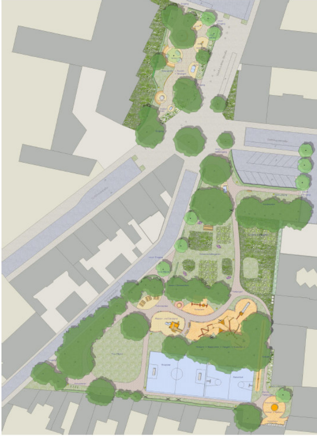
Entwurf des Suermondt-Parks