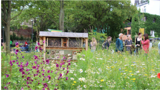
Das 'Multitalent' blüht auf