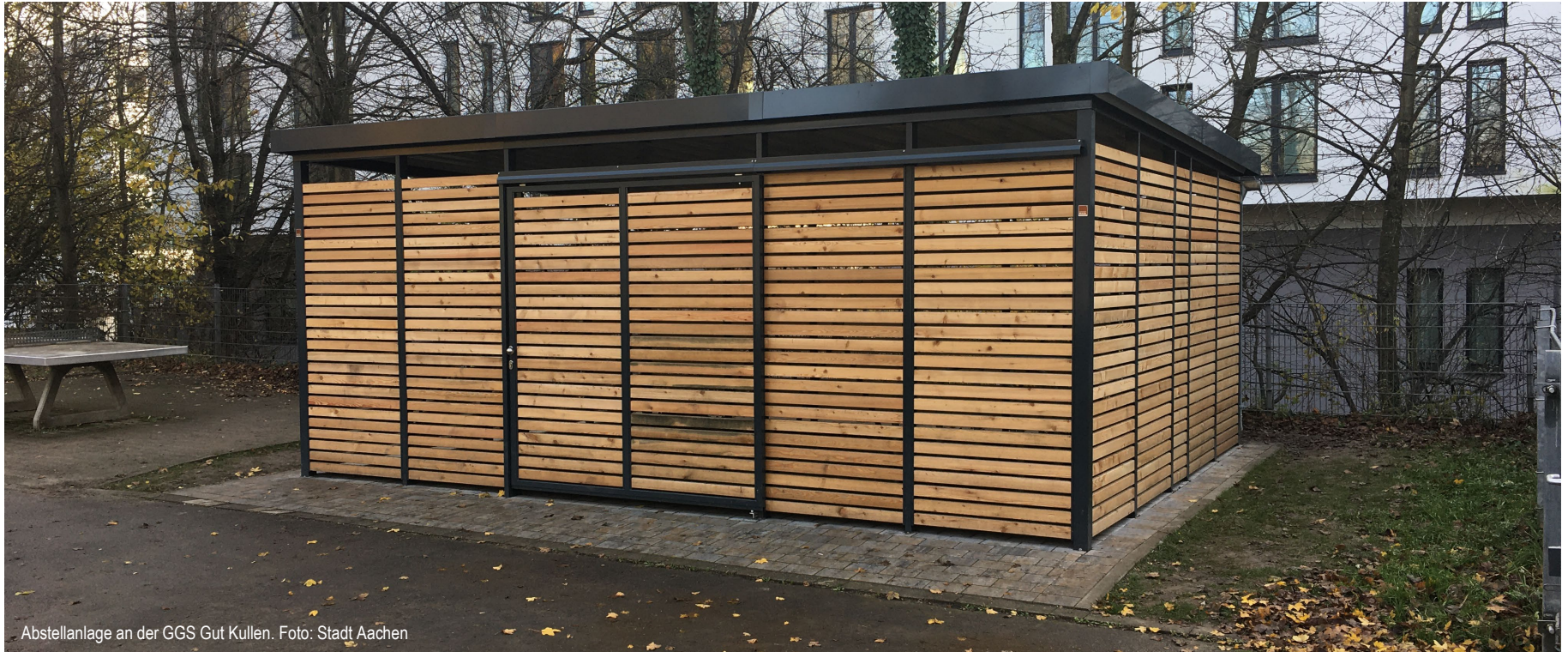
Abstellanlage an der GGS Gut Kullen.