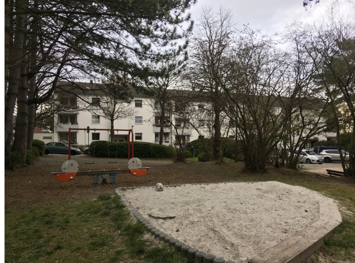
Bestand April 2022

Seit längerem besteht von vielen Familien des angrenzenden Wohngebietes der Wunsch nach einer Aufwertung des „Spiel- und Bolzplatzes Meerssener Straße“.