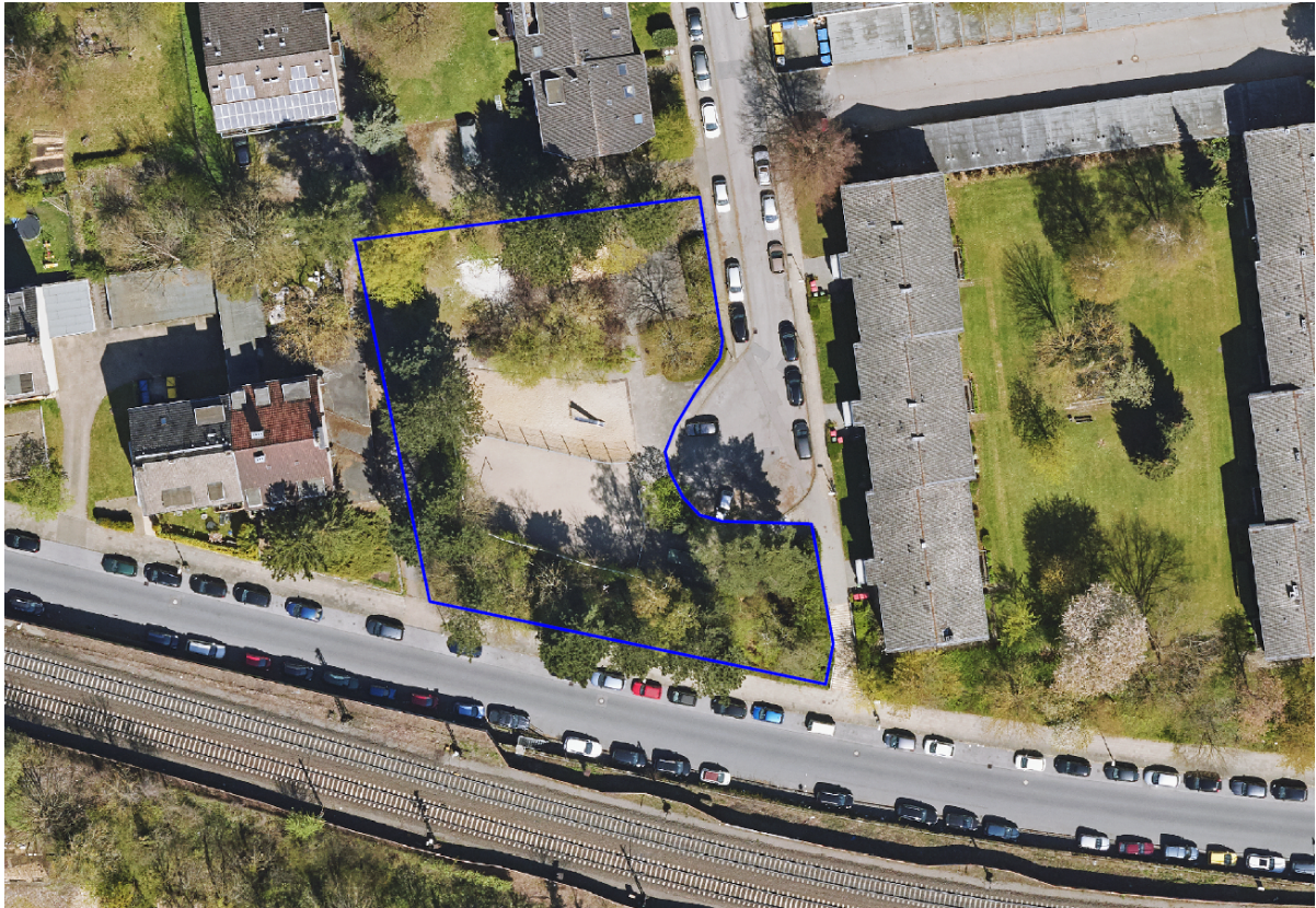
Luftbild Stand 2021

Im Aachener Westen, am Ende der „Meerssener Straße“, direkt an einem Wendehammer gelegen, befindet sich die gleichnamige Spiel- und Bolzplatzfläche, welche an drei Seiten durch alten Baumbestand und einen Zaun eingefasst ist. Zum Wendehammer hin besteht zurzeit keine Abgrenzung. Über eine Treppenanlage ist der Spielplatz auch von der Bleiberger Straße aus zu erreichen.