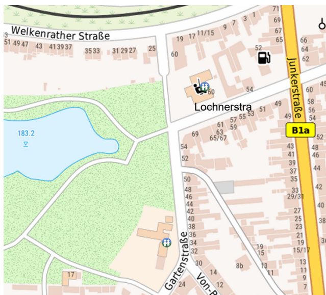
Ausschnitt aus dem GIS

Das Bebauungsplanverfahren ruht derzeit.