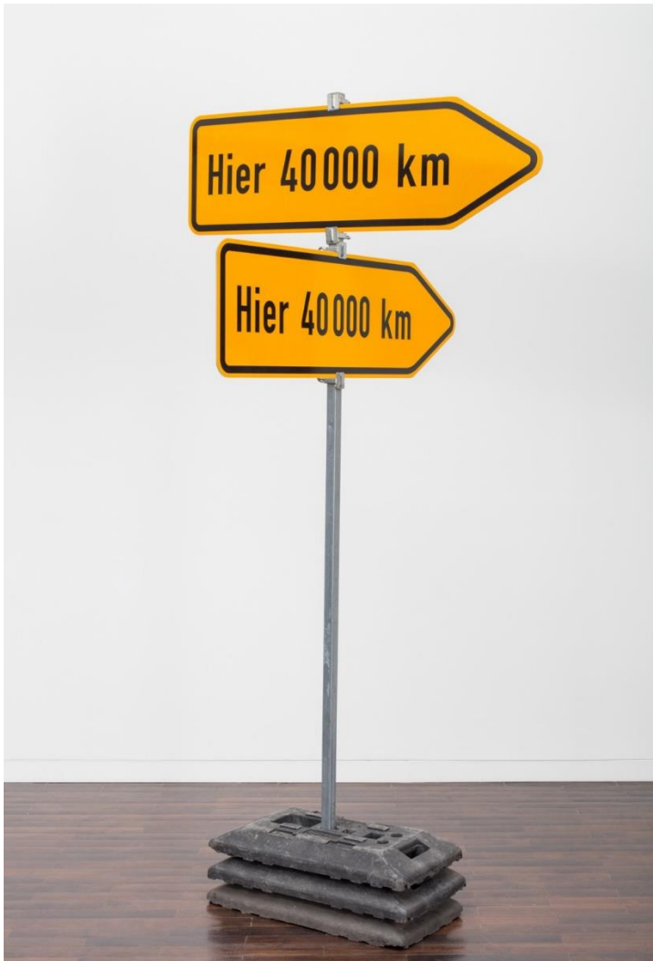
Timm Ulrich, Hier 40 000 km , 1969/2020, Foto: Carl Brunn