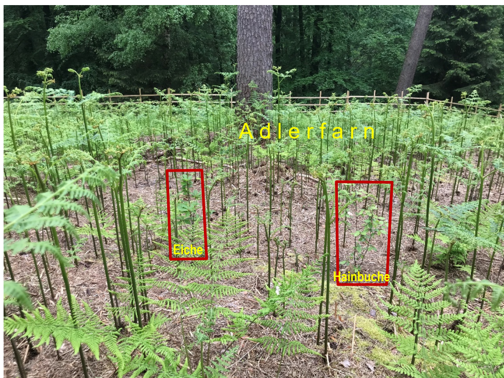
Eichenkultur mit aufkommendem Adlerfarn, vor dem Freischnitt (22.05.2023)

Die Pflicht zur Wiederaufforstung geht mit der Verpflichtung einher, diese Investitionen zu pflegen und zu schützen (§ 44 (2) LFoG). In diesem Zusammenhang werden Forstkulturen manuell mit Sense oder Freischneider freigeschnitten, sofern die Konkurrenzvegetation (meist Adlerfarn und Brombeere) dominiert und die Kultur gefährdet. Geplant ist ein zweimaliger Freischnitt auf rund 26,2 ha.