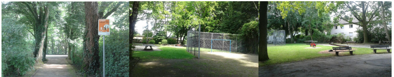
Aktuelle Situation Spiel-/Bolzplatz "Seffenter Weg"

durch den hohen Anteil im Lebensraum wohnender Jugendlicher und Studierende.