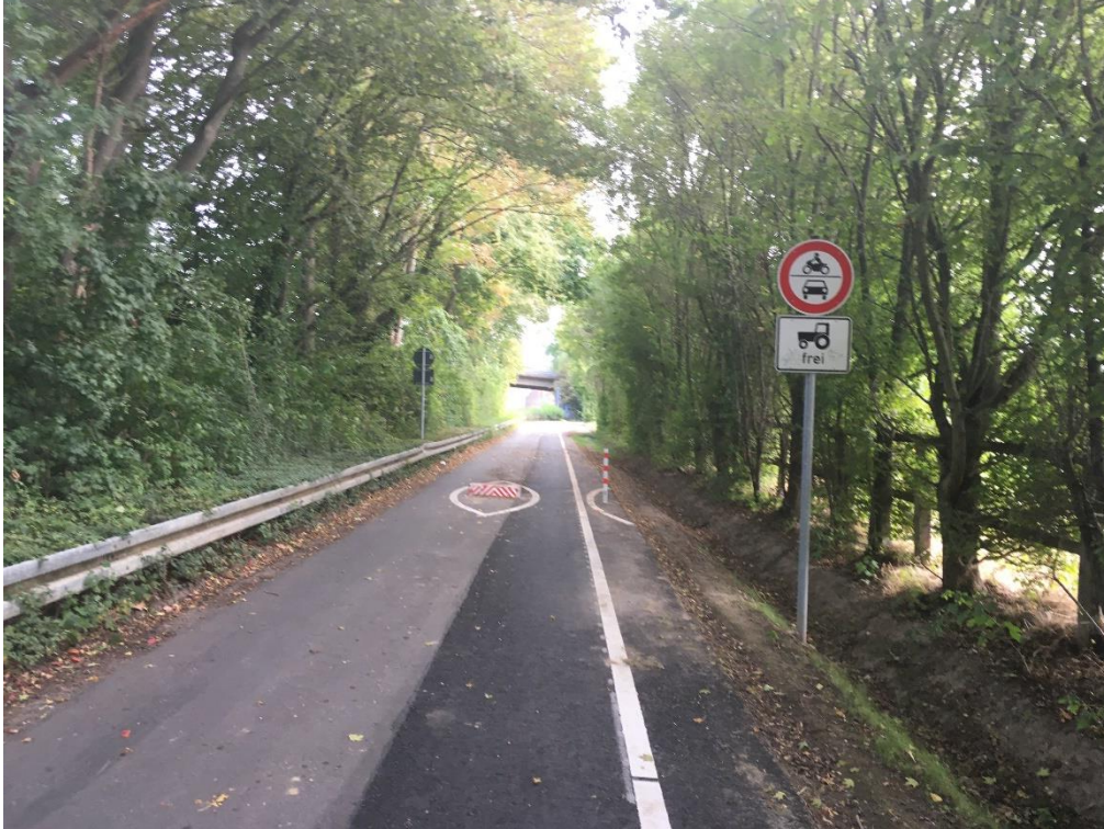
Baumaßnahme Sonnenweg: Bild 1