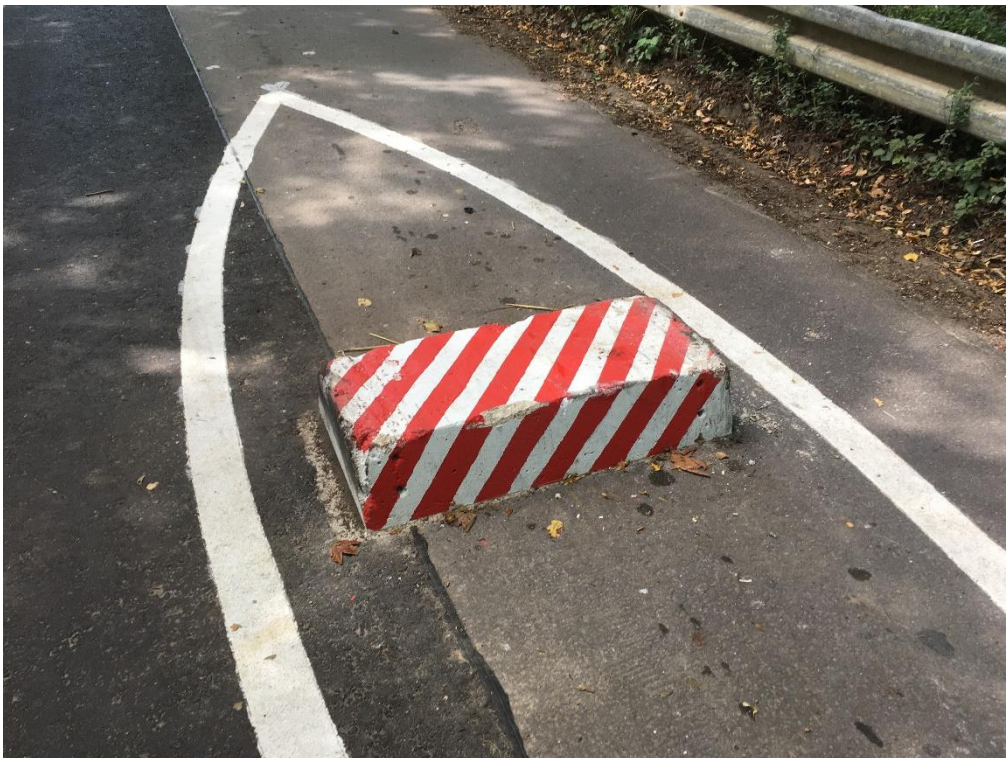
Baumaßnahme Sonnenweg: Bild 2