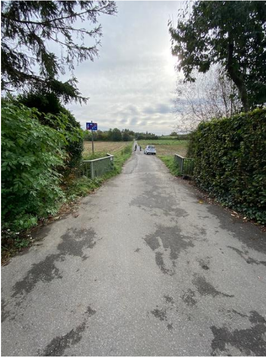
Bestand: Bild 1