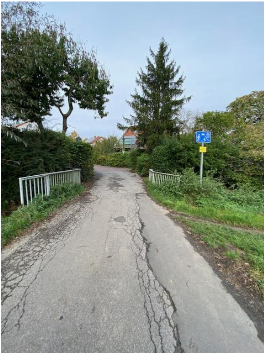
Bestand: Bild 2