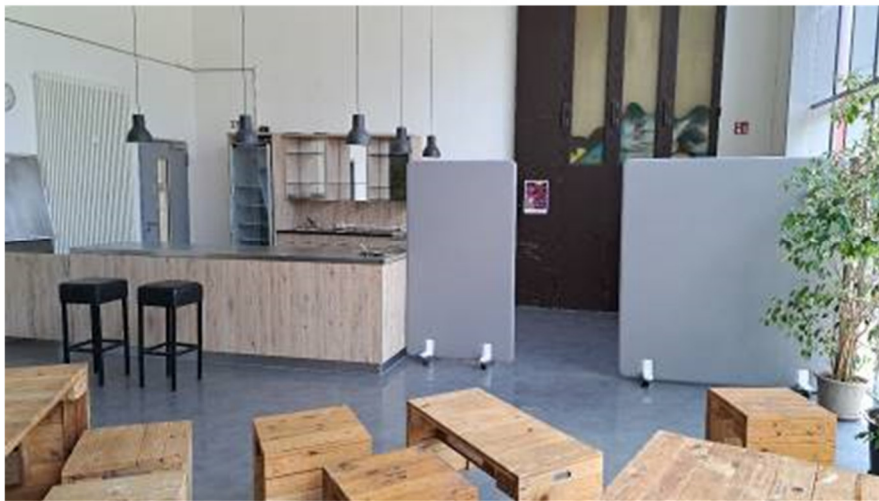
Ausschank-Theke im Foyer

gehisst, auch das dreitägige Programm bot eine beachtliche Vielfalt, von der Enthüllung einer Gedenkplakette und Teenagerliebe im Open Air-Kino über elektronisches Grundrauschen bis zum Familienfrühstück. Bei so viel Glitzer und Einhornpower hielten auch die grauen Regenwolken nicht lange stand. Farbe und Diversität steht Aachen eh viel besser. \ hep 9 Festival – Vom 11. bis 13. August wurde es bunt im Depot an der Talstraße. Erstmals setzte das Kulturfestival „EinzigARTig“ ein Zeichen für Diversität, Solidarität und Inklusion. Nicht die Verschiedenheit der Menschen, sondern das Gemeinsame soll im Mittelpunkt stehen. „Für die Zukunft würde ich mir wünschen, dass wir so ein Festival nicht bräuchten. Denn dann wäre Inklusion in der Gesellschaft angekommen“, eröffnete Rainer Beck die Veranstaltung. Vielleicht schafft es dieser Gedanke ja in Zukunft in die Köpfe aller. Und so lange das noch nicht passiert, wird „EinzigARTig“ keine Eintagsfliege sein. \ wo 10 Isle of Art – Das Kimiko-Festival am Ludwig Forum ist eine feste Größe im Sommerkalender – der Garten mit der Mains- tage ist eine ebenso tolle Location wie die Disko unter Bäumen und die Bühne vor der Borofsky-Clownsballerina, auf denen unter anderem Mola, Makko und Altin Gün begeisterten ... \ hep