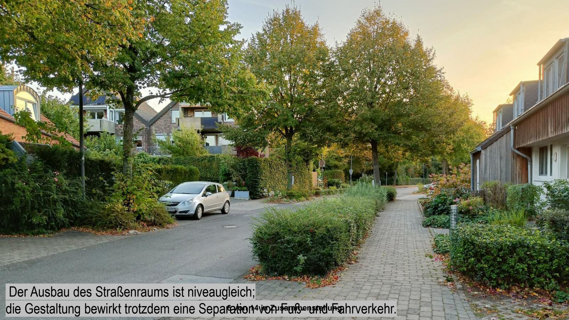
Der Ausbau des Straßenraums ist niveaugleich; die Gestaltung bewirkt trotzdem eine Separation von Fuß- und Fahrverkehr.