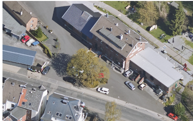
Ansicht des Standortes vor der Fällung.

Der Stadt Aachen ist besonders wichtig, Altbäume zu schützen und zu pflegen, denn der Altbaumbestand ist ein wichtiger Baustein zur Klimaanpassung und nachhaltigen Stadtentwicklung. Vitale Altbäume sind Klimaspezialisten, die sich über Jahrzehnte an den Extremstandort Stadt angepasst haben und dabei gut gediehen sind. Sie verfügen über ein weitverzweigtes, tiefreichendes Wurzelsystem, das sie fest im Boden verankert und zuverlässig mit Wasser und Nährstoffen versorgt. Dadurch überstehen sie Trockenperioden, extreme Winde und Starkregen besser als Jungbäume.